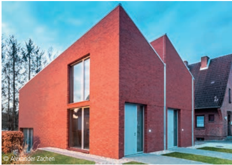
6100-1586 Doppelhaus (2 WE) Doppel- und Reihenhäuser JEBENS SCHOOF ARCHITEKTEN BDA Heide