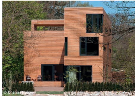
6100-1094 Einfamilienhaus - Effizienzhaus 70* Ein- und Zweifamilienhäuser, unterkellert Wacker Zeiger Architekten Hamburg