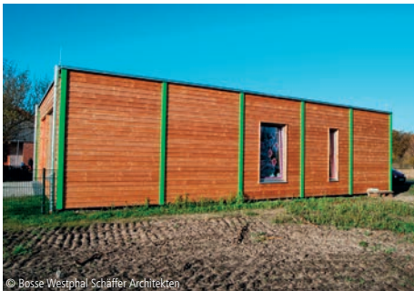
4400-0289 Kindergarten (1 Gr, 12 Kinder) - Modulbau* Kindergärten, nicht unterkellert

🏠 Bosse Westphal Schäffer Architekten Winsen/Luhe