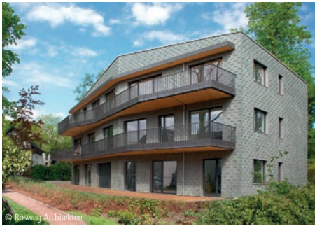
6100-1241 Mehrfamilienhaus (6 WE), TG - Effizienzhaus 85 Mehrfamilienhäuser