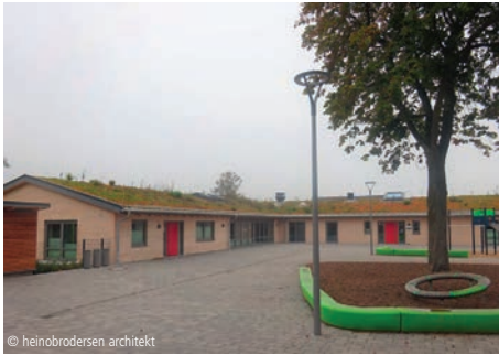
6400-0113 Bildungscampus - Effizienzhaus ~87% Gemeindezentren