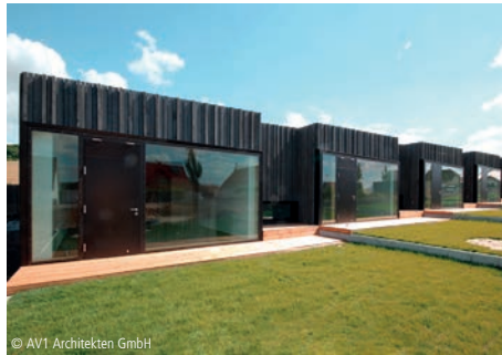
4400-0249 Kindertagesstätte (6 Gruppen, 90 Kinder)* Kindergärten, nicht unterkellert AV1 Architekten GmbH Kaiserslautern