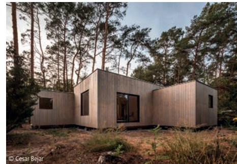
6100-1539 Einfamilienhaus Ein- und Zweifamilienhäuser, nicht unterkellert Zeller & Moye Berlin