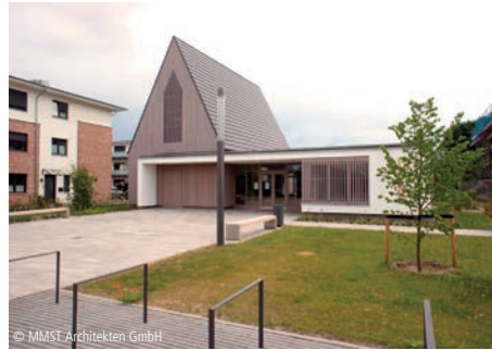
6400-0114 Kirchliches Gemeindezentrum Gemeindezentren