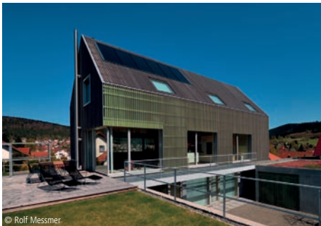
6100-1559 Einfamilienhaus, Praxis - Passivhaus Ein- und Zweifamilienhäuser, Passivhausstandard messmerarchitektur gmbh Wehingen