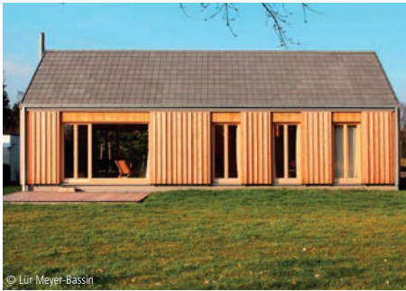
6100-1563 Ferienhaus (1 WE), Garage Ein- und Zweifamilienhäuser, nicht unterkellert meyer-bassin und partner freie architekten bda Dresden