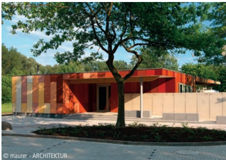
6400-0063 Begegnungszentrum Gemeindezentren maurer - ARCHITEKTUR Vechelde