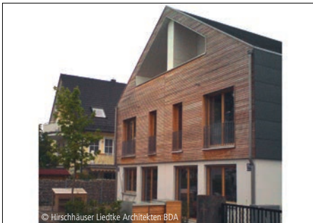
6100-1048 Doppelhaushälfte - KfW 60 Doppel- und Reihenendhäuser Hirschhäuser Liedtke Architekten BDA München