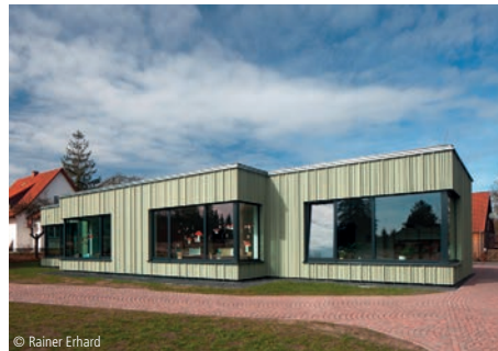
4400-0298 Kinderhort (40 Kinder) - Effizienzhaus ~30% Kindergärten, nicht unterkellert

🏠 Bosse Westphal Schäffer Architekten Winsen/Luhe