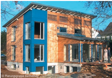
6100-0495 Einfamilienhaus, Holzrahmenbau* Ein- und Zweifamilienhäuser, unterkellert Planungsgruppe Barthelmey Erfurt