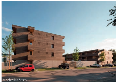
6100-1336 Mehrfamilienhäuser - Effizienzhaus ~38% Mehrfamilienhäuser 🏠 Deppisch Architekten GmbH Freising