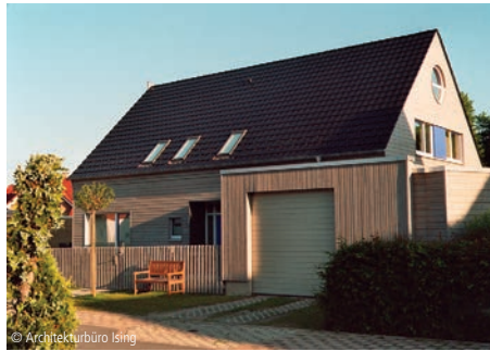
6100-0847 Einfamilienhaus, 2 Garagen - Effizienzhaus 40* Ein- und Zweifamilienhäuser, nicht unterkellert 🏠 Architekturbüro Ising Marsberg