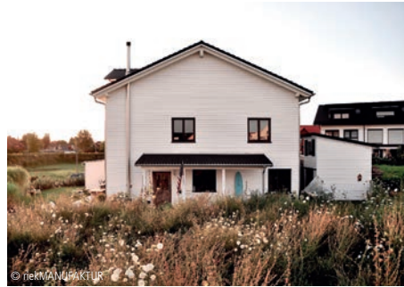
6100-1556 Doppelhaushälfte (1 WE) Ein- und Zweifamilienhäuser, unterkellert riekMANUFAKTUR Nonnenhorn