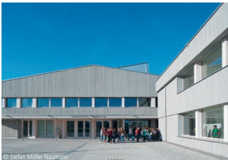
4100-0179 Gymnasium, Sporthalle - Plusenergiehaus Schulen