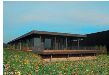
1300-0259 Bürogebäude (30 AP) - Effizienzhaus ~53% Büro- und Verwaltungsgebäude RAINER GRAF architekten GmbH Offerdingen