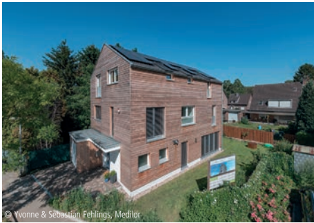
Medilor 6100-1474 Einfamilienhaus - Passivhaus Ein- und Zweifamilienhäuser, Passivhausstandard bau grün ! energieeffiziente Gebäude Mönchengladbach