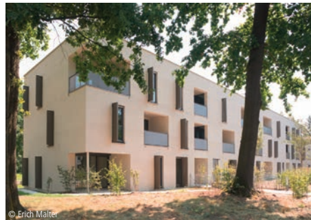
6100-1560 Mehrfamilienhaus (16 WE) Mehrfamilienhäuser wbg Nürnberg GmbH Immobilienunternehmen Nürnberg