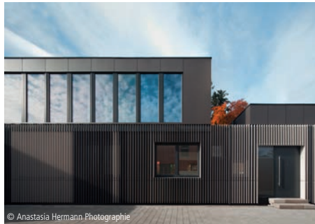
6100-1291 Einfamilienhaus, Garage Ein- und Zweifamilienhäuser, unterkellert 🏠 studio moeve architekten Darmstadt