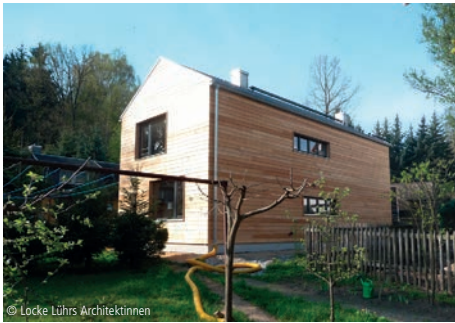
6100-0828 Einfamilienhaus - Effizienzhaus 70* Ein- und Zweifamilienhäuser, nicht unterkellert 🏠 Locke Lührs Architektinnen Dresden