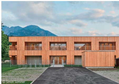
4400-0362 Kindertagesstätte (124 Ki) - Effizienzhaus ~36% Kindergärten, nicht unterkellert ☞ härtner architekten PartGmbB Stuttgart