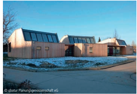
4100-0198 Gesamtschule Tanz- und Atelierräume (3 Kl) Schulen

🏠 qbatur Planungsgenossenschaft eG Quedlinburg