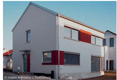
6100-0980 Einfamilienhaus - Effizienzhaus 55* Ein- und Zweifamilienhäuser, unterkellert evaplan Architektur + Stadtplanung Karlsruhe