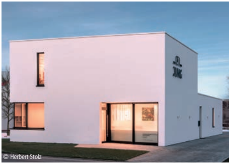
3100-0033 Arztpraxis, Oralchirurgie, Kinderzahnheilkunde Sonstige Gebäude

PURE GRUPPE Architektengesellschaft mbH Regensburg