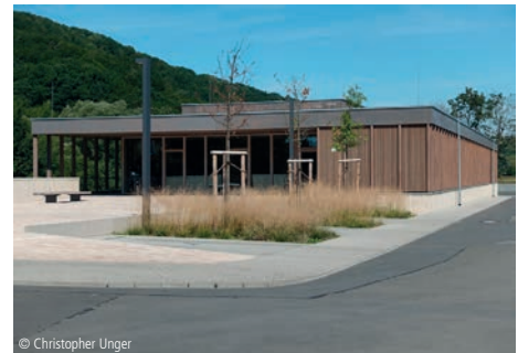
6400-0105 Bürgerhaus Gemeindezentren

🏠 STUDIOBORNHEIM Unger Ritter Architekten PartG mbB, Frankfurt am Main