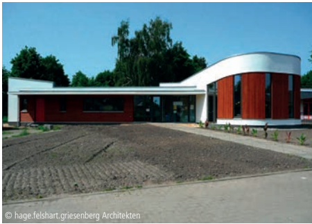
6400-0082 Gemeindehaus Gemeindezentren

🏠 hage.felshart.griesenberg Architekten BDA Ahrensburg