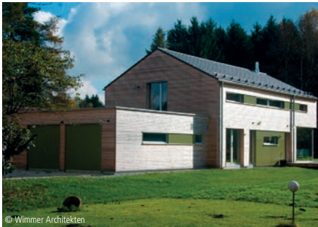
6100-1042 Einfamilienhaus, Doppelgarage - Passivhaus* Ein- und Zweifamilienhäuser, Passivhausstandard Wimmer Architekten Rosenheim