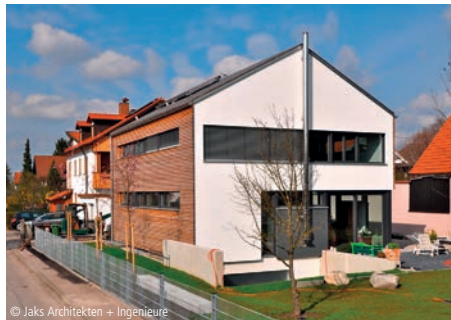
6100-0873 Einfamilienhaus - Effizienzhaus 70* Ein- und Zweifamilienhäuser, unterkellert 🏠 Jaks Architekten + Ingenieure München