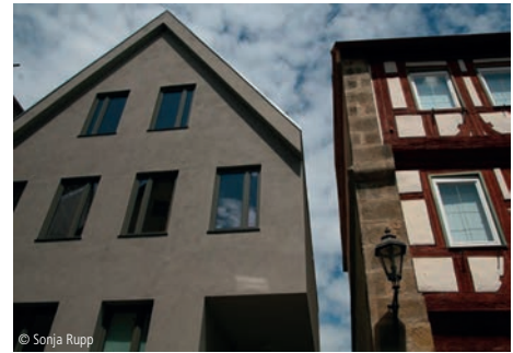
6100-1254 Einfamilienhaus - Effizienzhaus 55 Ein- und Zweifamilienhäuser, unterkellert