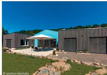
6100-1562 Einfamilienhaus, Büro, Passivhaus Ein- und Zweifamilienhäuser, Passivhausstandard Shakti Haus Bad König