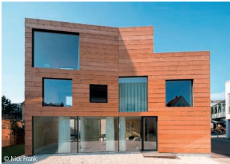
1300-0235 Bürogebäude (12 AP) - Effizienzhaus ~60% Büro- und Verwaltungsgebäude MIND Architects Collective Bischofsheim