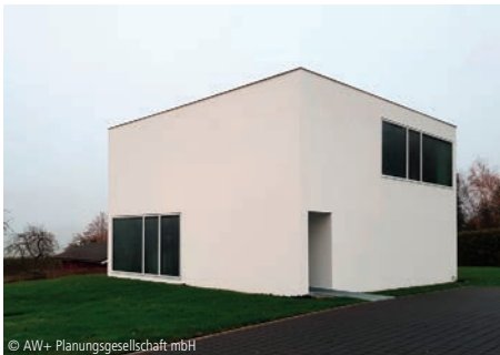
1300-0254 Bürogebäude (8 AP) - Effizienzhaus ~73% Büro- und Verwaltungsgebäude AW+ Planungsgesellschaft mbH Eiterfeld