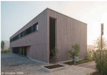
4400-0356 Kindergarten (4 Gr, 112 Ki), Wohnungen (4WE) Kindergärten, nicht unterkellert goldbrunner + hrycyk architekten München