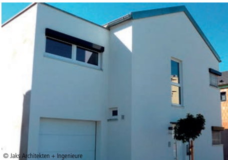
6100-0874 Doppelhaushälfte, Garage* Ein- und Zweifamilienhäuser, unterkellert 🏠 Jaks Architekten + Ingenieure München