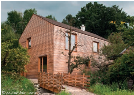
6100-1273 Einfamilienhaus - Effizienzhaus ~56% Ein- und Zweifamilienhäuser, nicht unterkellert

🏠 finsterwalderarchitekten Stephanskirchen