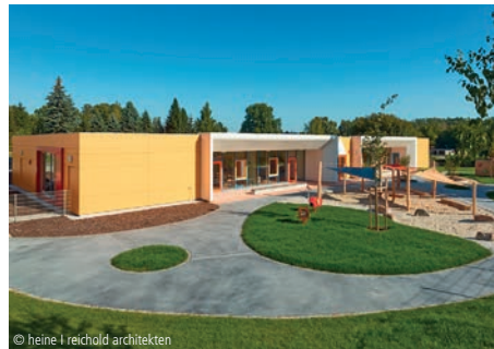
4400-0216 Kinderkrippe (4 Gruppen, 60 Kinder)* Kindergärten, nicht unterkellert

🏠 heine | reichold architekten Partnerschaftsgesell. mbB Lichtenstein