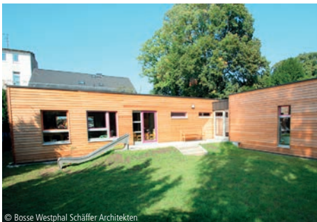
4400-0301 Kindertagesstätte (1 Gruppe, 25 Kinder) Kindergärten, nicht unterkellert

🏠 Bosse Westphal Schäffer Architekten Winsen/Luhe