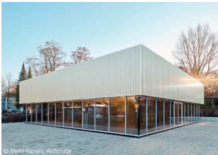
4100-0200 Selbstlernzentrum (60 Schüler) Schulen

🏠 qbatur Planungsgenossenschaft eG Quedlinburg