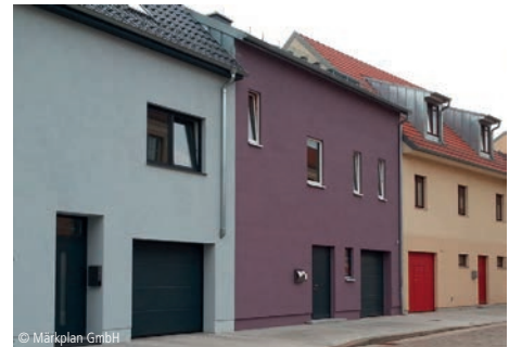
6100-1276 Einfamilienhaus, Garage - Effizienzhaus ~72% Ein- und Zweifamilienhäuser, nicht unterkellert

🏠 finsterwalderarchitekten Stephanskirchen