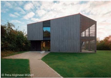
4400-0348 Kinderhort (4 Gruppen, 100 Kinder) Kindergärten, nicht unterkellert goldbrunner + hrycyk architekten München