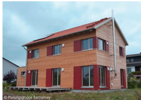
6100-1097 Einfamilienhaus, Carport - Effizienzhaus 55 Ein- und Zweifamilienhäuser, nicht unterkellert Planungsgruppe Barthelme Erfurt