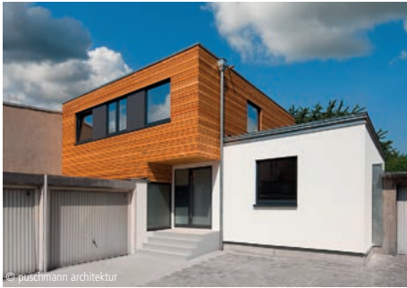
6100-1086 Einfamilienhaus - Effizienzhaus 55* Ein- und Zweifamilienhäuser, nicht unterkellert puschmann architektur Recklinghausen