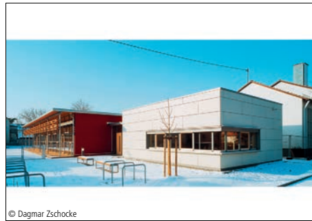
4400-0131 Kindertageseinrichtung (3 Gruppen)* Kindergärten, nicht unterkellert