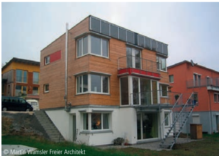
6100-0571 Einfamilienhaus - Passivhaus*

Architekten + Diplom-Ingenieure Jünger + Logar Darmstadt