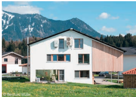
6100-1325 Einfamilienhaus - Effizienzhaus 40 Ein- und Zweifamilienhäuser, nicht unterkellert 🏠 brack architekten Kempten