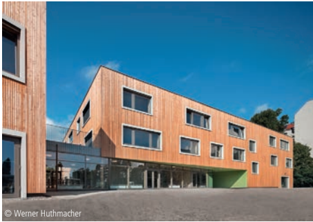
4200-0035 Bildungszentrum (400 Schüler) Schulen