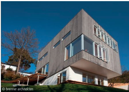
6100-0911 Einfamilienhaus* Ein- und Zweifamilienhäuser, unterkellert brenner architekten München