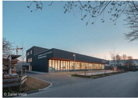
4200-0039 Bildungszentrum Holzbauberufe (4 Klassen) Schulen