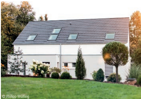
6100-1304 Einfamilienhaus, ELW Ein- und Zweifamilienhäuser, nicht unterkellert 🏠 adbarchitektur Wuppertal