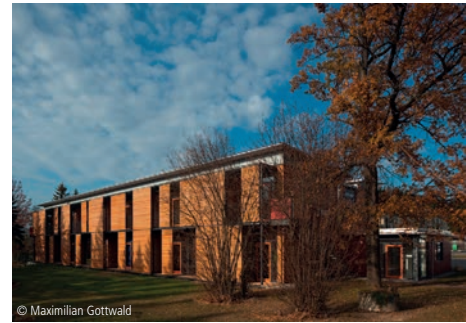
4400-0265 Kinderkrippe (6 Gruppen, 72 Kinder)* Kindergärten, nicht unterkellert ABHD Architekten Beck und Denzinger Neuburg a.d. Donau