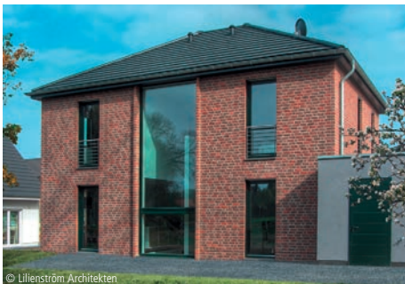
6100-1106 Einfamilienhaus, Garage - Effizienzhaus 70 Ein- und Zweifamilienhäuser, unterkellert Lilienström Architekten PartG mbB Dormagen