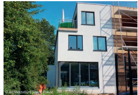
6100-0947 Doppelhaushälfte - Passivhaus Ein- und Zweifamilienhäuser, Passivhausstandard Architekturbüro Thyroff-Krause Kaltenkirchen