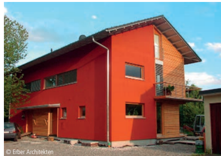
6100-0545 Doppelhaushälfte - KfW 40* Ein- und Zweifamilienhäuser, unterkellert Erber Architekten Lindau