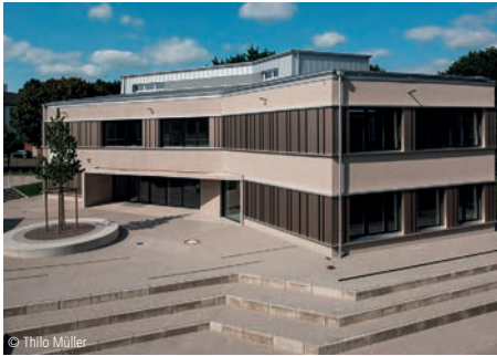
4100-0192 Ganztagschule (96 Schüler) - Passivhaus Schulen