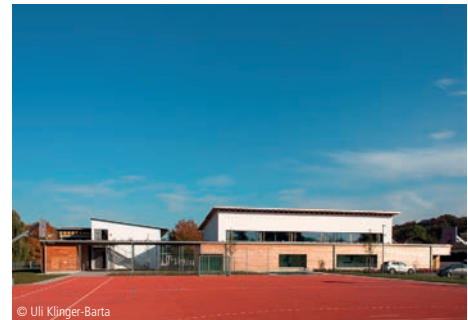
5100-0131 Sporthalle (Einfeldhalle) - Effizienzhaus ~31% Sonstige Gebäude ☞ Wagner Architekten Dingolfing