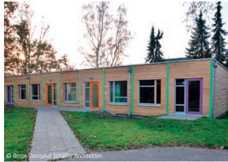
4100-0167 Oberschule (2 Klassen, 40 Schüler) Schulen

PURE GRUPPE Architektengesellschaft mbH Regensburg