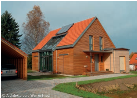
6100-0587 Einfamilienhaus - Passivhaus*