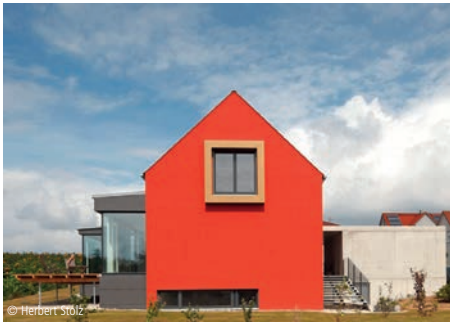
6100-0885 Einfamilienhaus - Effizienzhaus 40* Ein- und Zweifamilienhäuser, unterkellert fabi architekten bda Regensburg