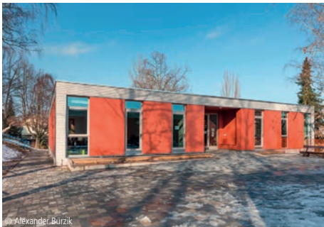
4100-0174 Gesamtschule (10 Kl) - Effizienzhaus ~66% Schulen