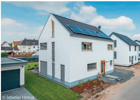
6100-1360 Einfamilienhaus, Garage - Passivhaus Ein- und Zweifamilienhäuser, Passivhausstandard bau grün ! energieeffiziente Gebäude Mönchengladbach