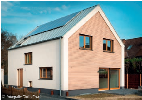
6100-1289 Einfamilienhaus, Garage - Effizienzhaus ~31% Ein- und Zweifamilienhäuser, unterkellert 🏠 bau grün ! energieeffiziente Gebäude Mönchengladbach