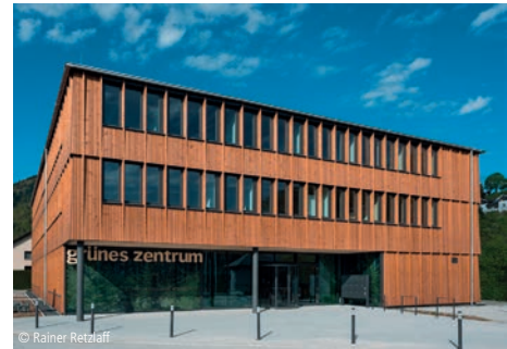
1300-0249 Verwaltungsgebäude (42 AP) Büro- und Verwaltungsgebäude F64 Architekten, Architekten u. Stadtplaner PartGmbH Kempten / Allgäu