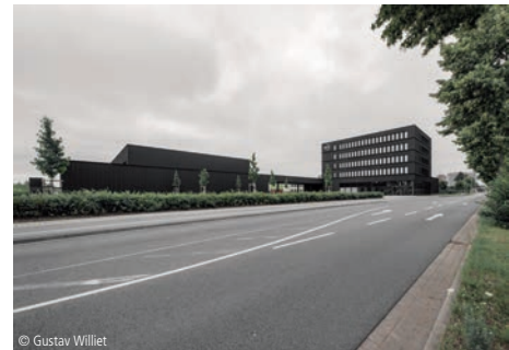
2200-0060 Forschungs- und Laborgebäude (275 AP) Sonstige Gebäude Schulz und Schulz Architekten GmbH Leipzig