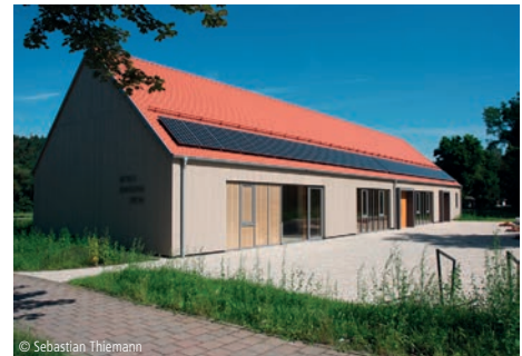
6400-0112 Evang. Gemeindezentrum - Effizienzhaus ~37% Gemeindezentren

🏠 MATTES//EPPMANN ARCHITEKTEN GbR Abstatt