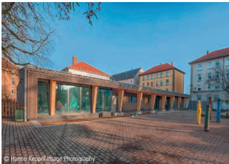
4400-0345 Kindertagesstätte (2 Gruppen, 45 Kinder) Kindergärten, nicht unterkellert

🏠 maurer - ARCHITEKTUR (LPH 1-5), Vechede und Jensen Gronau Architekten (LPH 6-9), Braunschweig