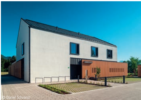
6200-0115 Hospiz (10 Betten) Sonstige Gebäude Sweco GmbH, München und HSP Projektmanagement, Beratung GmbH, Töging