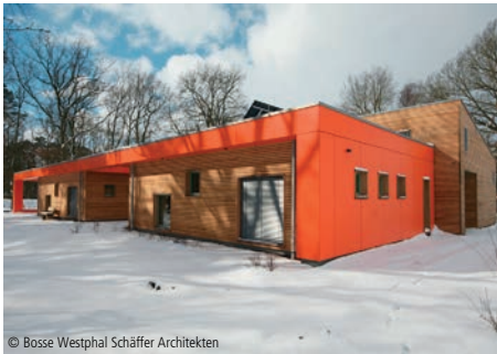
4400-0225 Kinderkrippe (2 Gruppen, 30 Kinder)* Kindergärten, nicht unterkellert ☞ Bosse Westphal Schäffer Architekten Winsen/Luhe