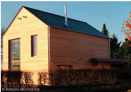
6100-1326 Einfamilienhaus, Carport - Passivhaus Ein- und Zweifamilienhäuser, Passivhausstandard 🏠 RoA RONGEN ARCHITEKTEN PartG mbB Wassenberg