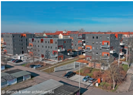
6100-1573 Wohnanlage (96 WE, 77 STP) Mehrfamilienhäuser dietzsch & weber architekten bda Halle (Saale)