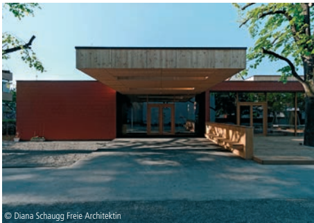
4400-0118 Kindertageseinrichtung (3 Gruppen)* Kindergärten, nicht unterkellert