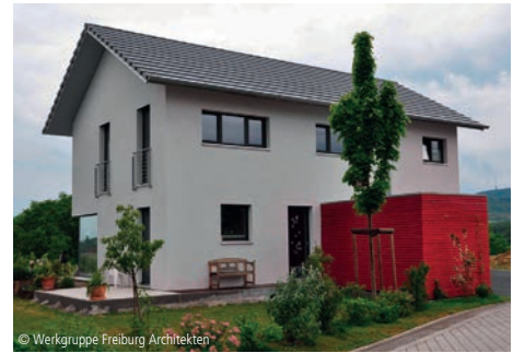
6100-0905 Einfamilienhaus - KfW 40* Ein- und Zweifamilienhäuser, unterkellert Werkgruppe Freiburg Architekten Freiburg