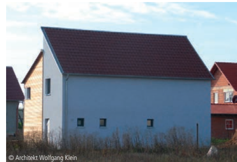
6100-0627 Einfamilienhaus - Passivhaus*