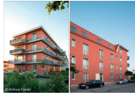
6100-1532 Mehrfamilienhäuser (2 Gebäude, 23 WE) Mehrfamilienhäuser Praeger Richter Architekten BDA Berlin