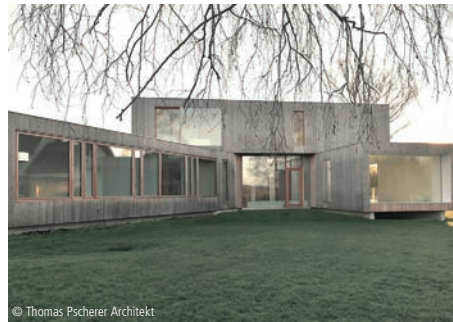
6100-1214 Einfamilienhaus, Garage - Effizienzhaus 70 Ein- und Zweifamilienhäuser, nicht unterkellert