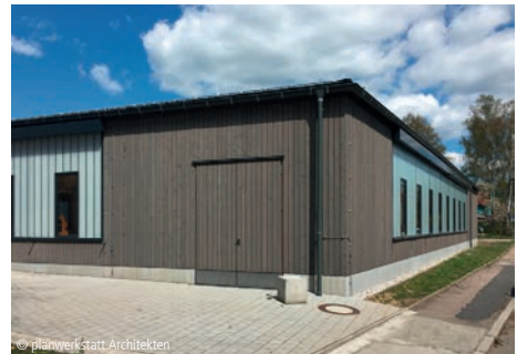
4200-0032 Berufsschule Schulen

🏠 PH2 Architektur + Stadtplanung Eschlkam