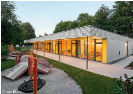
4400-0235 Kinderkrippe (3 Gruppen, 36 Kinder)* Kindergärten, nicht unterkellert ☞ goldbrunner + hrycyk architekten München