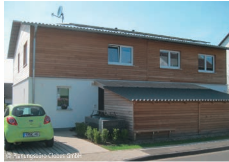
6100-1199 Doppelhaus - Effizienzhaus 55 Doppel- und Reihenendhäuser