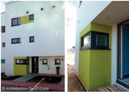
6100-1156 Reihemittelhaus - Passivhaus Ein- und Zweifamilienhäuser, Passivhausstandard Architekturbüro Thyroff-Krause Kaltenkirchen