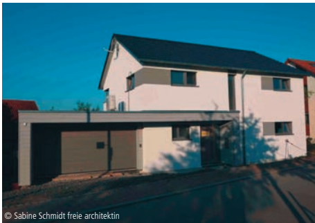
6100-1209 Zweifamilienhaus, Garage - Passivhaus Ein- und Zweifamilienhäuser, Passivhausstandard