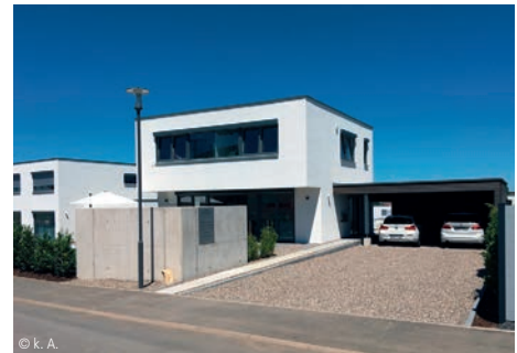
6100-1407 Einfamilienhaus, Garage - Effizienzhaus 55 Ein- und Zweifamilienhäuser, unterkellert 2P-Raum Architekten Nattheim