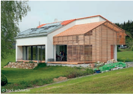
6100-1190 Einfamilienhaus, Garage - Effizienzhaus 40 Ein- und Zweifamilienhäuser, nicht unterkellert