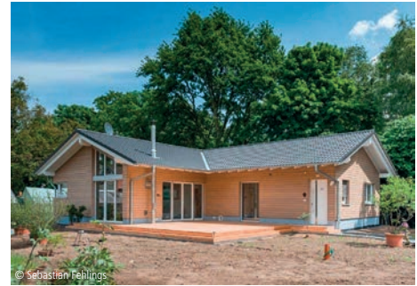
6100-1344 Einfamilienhaus - Effizienzhaus ~53% Ein- und Zweifamilienhäuser, nicht unterkellert bau grün ! energieeffiziente Gebäude Mönchengladbach