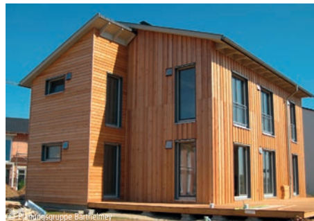
6100-1031 Einfamilienhaus - Effizienzhaus 70* Ein- und Zweifamilienhäuser, unterkellert Planungsgruppe Barthelmey Erfurt