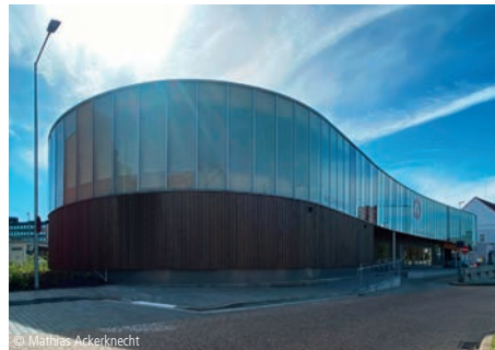
7800-0030 Fahrradparkhaus (224 STP) Sonstige Gebäude

Eßmann | Gärtner | Nieper Architekten GbR Leipzig