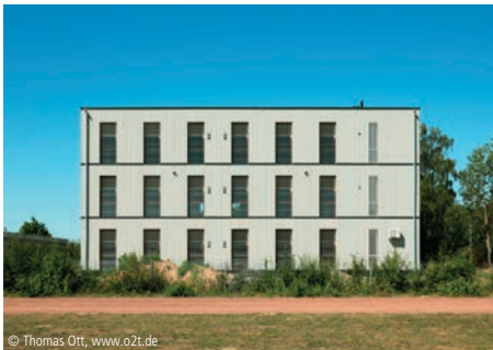
4100-0219 Gymnasium (12 Kl, 330 Sch), Erweiterung Schulen