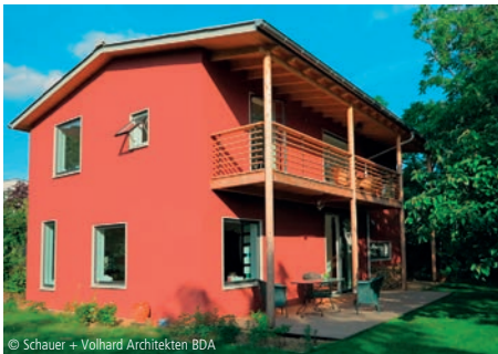
6100-1078 Einfamilienhaus* Ein- und Zweifamilienhäuser, nicht unterkellert Schauer + Volhard Architekten BDA Darmstadt