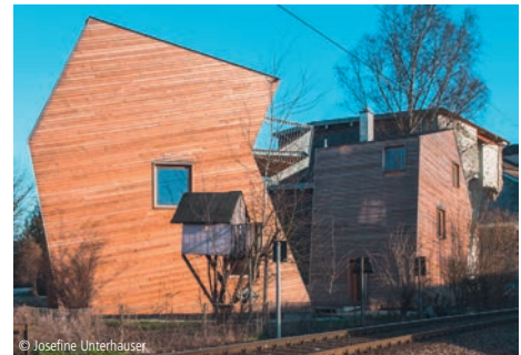
6100-1272 Einfamilienhäuser - Effizienzhaus ~50% Ein- und Zweifamilienhäuser, nicht unterkellert