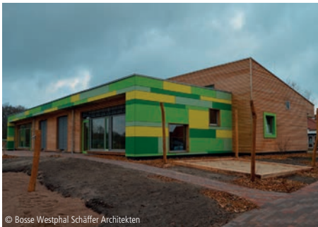
4400-0273 Kinderkrippe (2 Gruppen, 30 Kinder) Kindergärten, nicht unterkellert Bosse Westphal Schäffer Architekten Winsen/Luhe