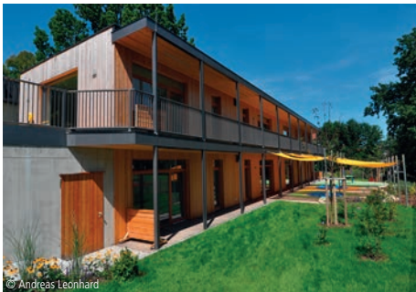
4400-0250 Kinderkrippe (4 Gruppen, 50 Kinder) Kindergärten, nicht unterkellert Leonhard Architekten München