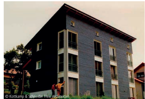
6100-0212 Doppelhaushälfte Holzrahmenbau* Doppel- und Reihendhäuser ☞ Kottkamp & Schneider Freie Architekten VFA Stuttgart