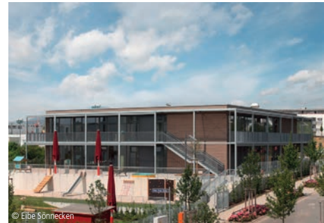
4400-0234 Kindertagesstätte (5 Gr, 100 Ki) - Passivhaus* Kindergärten, nicht unterkellert ☞ Birk Heilmeyer und Frenzel Gesellschaft von Architekten mbH, Stuttgart