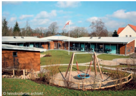
4400-0255 Kinderkrippe (4 Gruppen, 40 Kinder) Kindergärten, nicht unterkellert heinobrodersen architekt Flensburg