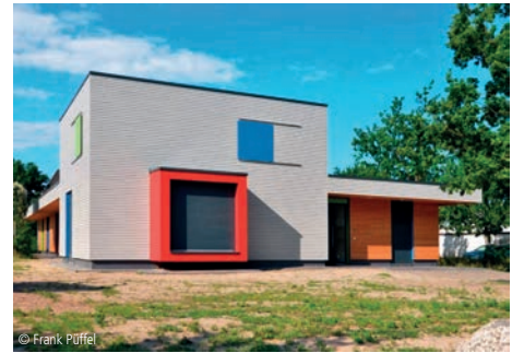
6400-0094 Spielhaus, Jugendtreff - Effizienzhaus ~62% Gemeindezentren

🏠 hage.felshart.griesenberg Architekten BDA Ahrensburg