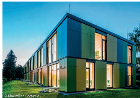
4100-0183 Mittelschule (125 Sch) - Effizienzhaus ~72% Schulen

Hermann Kaufmann ZT GmbH & Florian Nagler Architekten GmbH "ARGE Diedorf", München