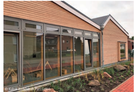
4400-0360 Kinderkrippe (3 Gruppen, 45 Kinder) Kindergärten, nicht unterkellert ☞ KUKUK Architekten Partnerschaftsgesellschaft mbB Bremen