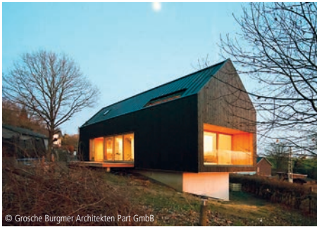
6100-1531 Einfamilienhaus - Effizienzhaus ~63% Ein- und Zweifamilienhäuser, unterkellert Grosche Burgmer Architekten Part GmbB Köln