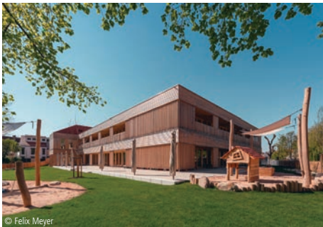
4400-0351 Kindertagesstätte (6 Gruppen, 138 Kinder) Kindergärten, nicht unterkellert Bär Stadelmann Stöcker Architekten und Stadtplaner PartGmbH, Nürnberg