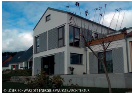
6100-1240 Einfamilienhaus, Carport - Effizienzhaus 70* Ein- und Zweifamilienhäuser, nicht unterkellert

LÖSER-SCHWARZOTT ENERGIE.BEWUSSTE.ARCHITEKTUR. ARCHITEKTUR., Regensburg