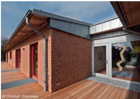
4400-0190 Kindertagesstätte (4 Gruppen)* Kindergärten, nicht unterkellert

🏠 evaplan Architektur + Stadtplanung Karlsruhe