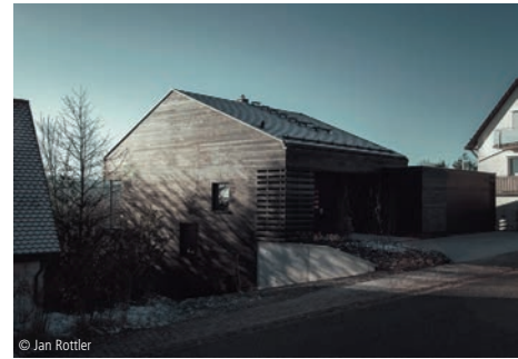
6100-1564 Einfamilienhaus, Garage Ein- und Zweifamilienhäuser, unterkellert Partner und Partner Architekten Berlin