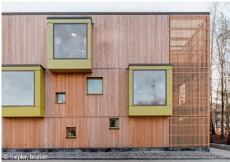
4400-0284 Kinderhort (150 Kinder) - Effizienzhaus ~32% Kindergärten, nicht unterkellert

🏠 Raum und Bau Planungsgesellschaft mbH München