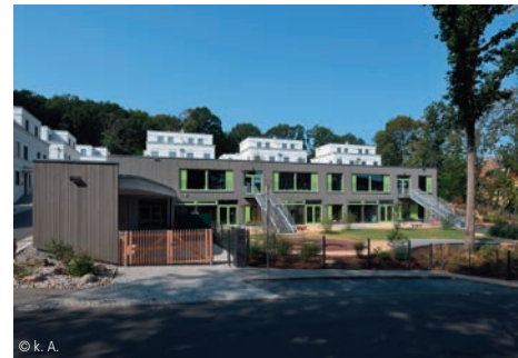
4400-0347 Kindertagesstätte (7 Gruppen, 110 Kinder) Kindergärten, nicht unterkellert