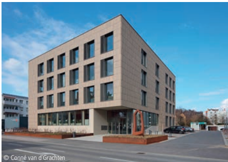
1300-0292 Landratsamt (136 AP), TG - Effizienzhaus ~44% Büro- und Verwaltungsgebäude ArGe Gurland+Seher+Rapp Architekten Biberach a.d. Riss