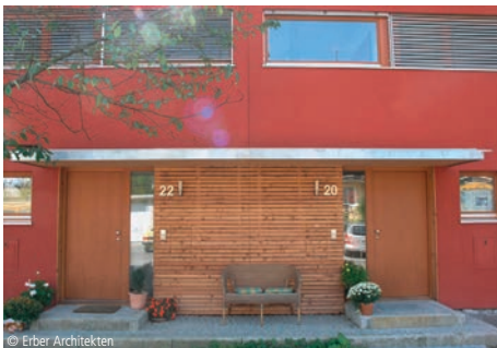
6100-0549 Doppelhaushälfte - KfW 60* Ein- und Zweifamilienhäuser, unterkellert Erber Architekten Lindau