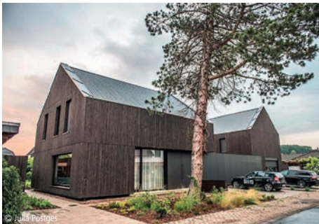
6100-1495 Einfamilienhaus Ein- und Zweifamilienhäuser, nicht unterkellert Ruge+Göllner GmbH Vechta