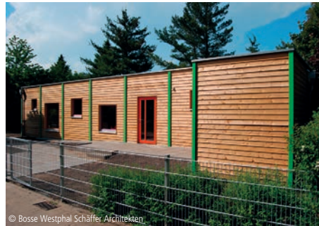
4400-0288 Kinderkrippe (1 Gr, 12 Kinder) - Modulbau Kindergärten, nicht unterkellert

🏠 Raum und Bau Planungsgesellschaft mbH München