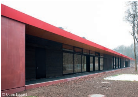
4400-0256 Kinderkrippe (4 Gr, 48 Ki) - Effizienzhaus ~76%* Kindergärten, nicht unterkellert Schindhelm Moser Architekten München