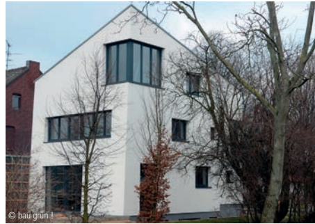
6100-0991 Einfamilienhaus* Ein- und Zweifamilienhäuser, unterkellert bau grün ! energieeffiziente Gebäude Mönchengladbach