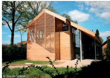
6400-0078 Gemeindehaus Gemeindezentren Stoy-Architekten Neumünster