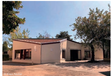
4100-0204 Unterrichtsgebäude (2 Klassen, 56 Schüler) Schulen