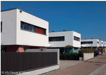
6100-1541 Einfamilienhäuser (6 WE) - Effizienzhaus ~31% Sonstige Gebäude ASs Flassak & Tehrani Freie Architekten und Stadtplaner, Stuttgart