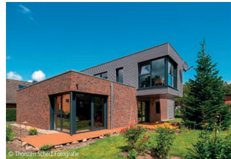
6100-1546 Einfamilienhaus, Carport Ein- und Zweifamilienhäuser, nicht unterkellert Henschke Schulze Reimers Architekten Lüneburg