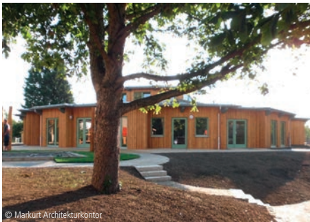
4400-0266 Kindertagesstätte (80 Ki) - Effizienzhaus ~10%* Kindergärten, nicht unterkellert Markurt Architekturkontor Wermisdorf