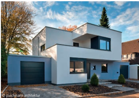
6100-1096 Einfamilienhaus, Garagen* Ein- und Zweifamilienhäuser, nicht unterkellert puschmann architektur Recklinghausen