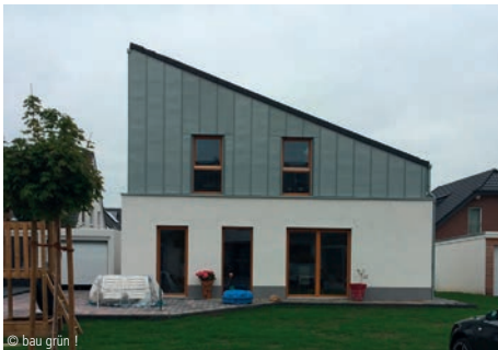
6100-1217 Einfamilienhaus, Garage - Effizienzhaus 40* Ein- und Zweifamilienhäuser, nicht unterkellert