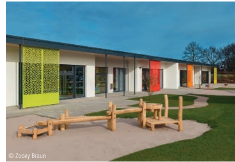
4400-0316 Kindertagesstätte (97 Ki) - Effizienzhaus ~67% Kindergärten, nicht unterkellert

🏠 Kemper Steiner & Partner Architekten GmbH Bochum