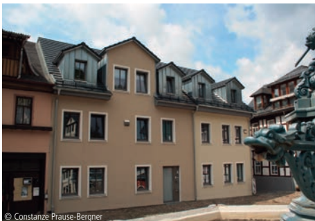
6100-1561 Mehrfamilienhaus (7 WE) - Effizienzhaus ~21% Mehrfamilienhäuser Architekturbüro Constanze Prause-Bergner Remptendorf