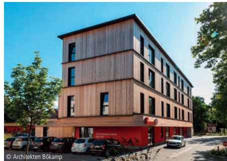
6200-0118 Begegnungsstätte, Tagespflege, Wohnheim Sonstige Gebäude Architekten Bökamp Bad Oeynhausen