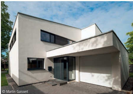
6100-1268 Einfamilienhaus, Garage - Effizienzhaus 55 Ein- und Zweifamilienhäuser, unterkellert