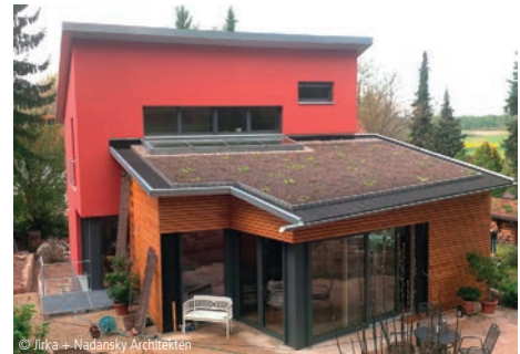
6100-1365 Einfamilienhaus - Effizienzhaus 40 Ein- und Zweifamilienhäuser, unterkellert Jirka + Nadansky Architekten Hohen Neuendorf