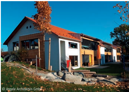
4400-0339 Kindertagesstätte (99 Ki) - Effizienzhaus ~26%* Kindergärten, nicht unterkellert

🏠 Prof. Rollmann + Partner Architekten PartGmbH Homburg