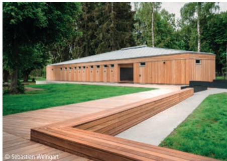
5300-0019 Flussbad, Eingangsgebäude, Brücke Sonstige Gebäude ☞ JORDAN BALZER SCHUBERT Architekten PartG mbH Dresden