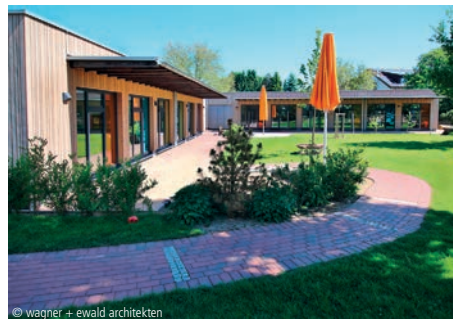
4400-0307 Kindertagesstätte (100 Ki) - Effizienzhaus ~60% Kindergärten, nicht unterkellert

🏠 Bosse Westphal Schäffer Architekten Winsen/Luhe