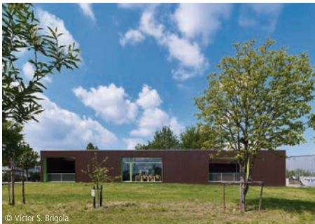
6400-0110 Jugendhaus Gemeindezentren

🏠 STUDIOBORNHEIM Unger Ritter Architekten PartG mbB, Frankfurt am Main