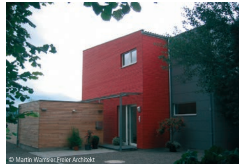
6100-0575 Einfamilienhaus - Passivhaus*