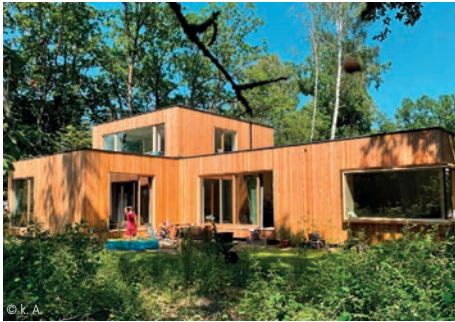
6100-1550 Einfamilienhaus, Doppelgarage Ein- und Zweifamilienhäuser, nicht unterkellert burgemeister+marx architekten Berlin