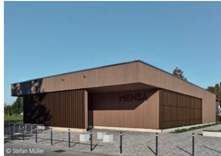
6500-0055 Schulmensa (160 Sitzplätze) Sonstige Gebäude