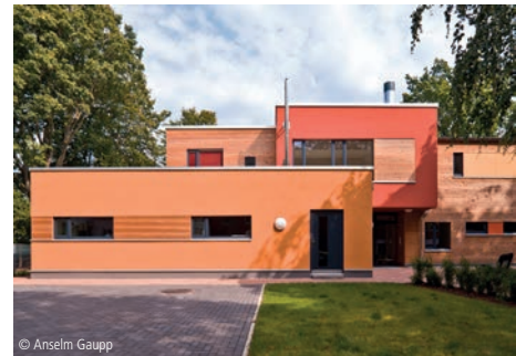
4400-0282 Kindertagesstätte (8 Gruppen, 140 Kinder)* Kindergärten, nicht unterkellert Neustadtarchitekten (LPH 1-5) und lup-architekten (LPH 6-9), Hamburg