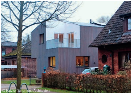
6100-1382 Einfamilienhaus, teilunterkellert Ein- und Zweifamilienhäuser, unterkellert Hatzius Sarramona Architekten Hamburg