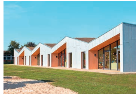
4400-0344 Kindertagesstätte (4 Gruppen, 60 Kinder) Kindergärten, nicht unterkellert