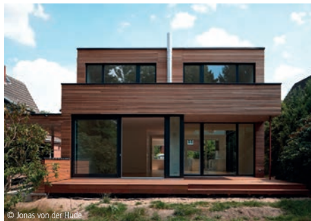
6100-0883 Einfamilienhaus - KfW 60* Ein- und Zweifamilienhäuser, unterkellert 🏠 Hatzius Sarramona Architekten Hamburg