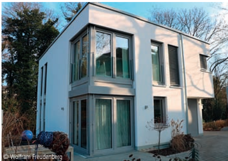
6100-1352 Einfamilienhaus, Carport