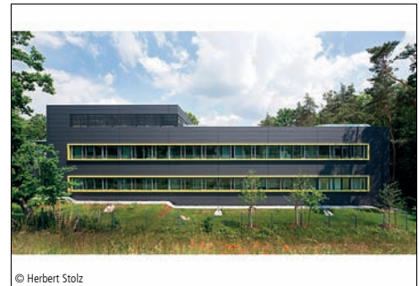
2200-0049 Bioforschungszentrum Seite 80

Bodamer Faber Architekten BDA (LPH 2-5) Stuttgart