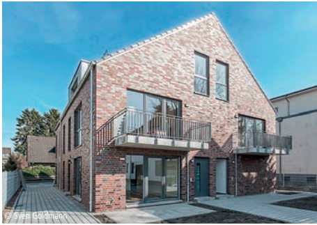
6100-1334 Mehrfamilienhaus (6 WE)