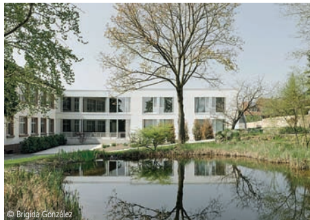
6200-0084 Wohn- und Pflegeheim (28 Betten)

🏠 Parmakerli-Fountis Gesellschaft von Architekten mbH Kleinmachnow