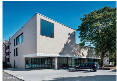
6400-0099 Gemeindehaus, Wohnung (1 WE)