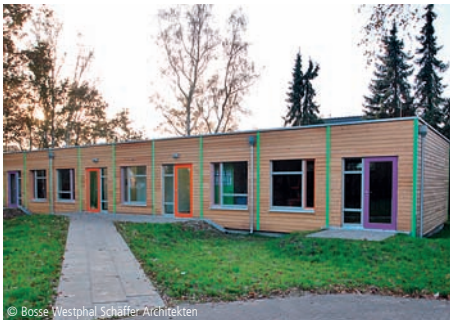
4100-0167 Oberschule (2 Klassen, 40 Schüler) Modulbau

🏠 GSP Gerlach Schneider Partner Architekten mbB Bremen