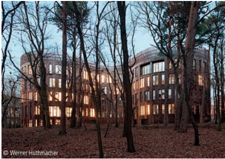
2200-0050 Forschungsgebäude, Rechenzentrum (215 AP) Seite 86

🏠 BHBVT Gesellschaft von Architekten mbH Berlin