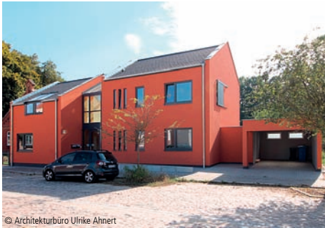
6100-1343 Pfarrhaus, Gemeindebüros

Arnold und Gladisch Gesellschaft von Architekten mbH, Berlin