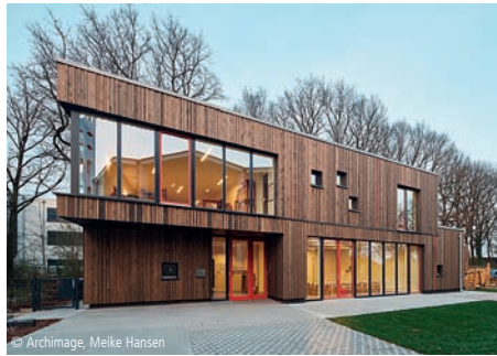
4400-0303 Kindertagesstätte (3 Gruppen, 58 Kinder) Seite 274

LANDHERR / Architekten und Ingenieure GmbH Hoppegarten