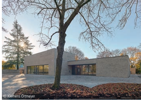
6400-0106 Gemeindehaus

🏠 STUDIOBORNHEIM Unger Ritter Architekten PartG mbB, Frankfurt am Main