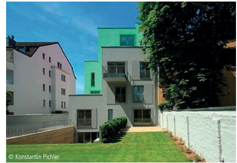
6100-1319 Mehrfamilienhaus (9 WE) Seite 388