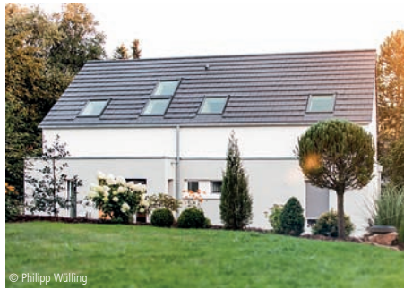
6100-1304 Einfamilienhaus, ELW