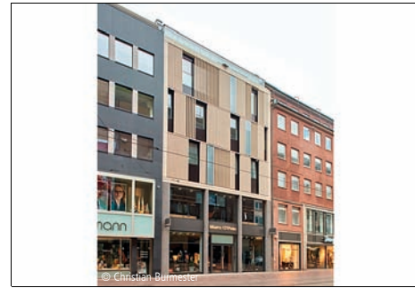
7200-0092 Geschäftshaus, Wohnung (1 WE)

🏠 nhp Neuwald Dulle Architekten - Ingenieure Seevetal