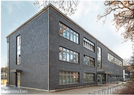
4100-0178 Gymnasium (6 Klassen), Sporthalle (Einfeldhalle) Seite 162