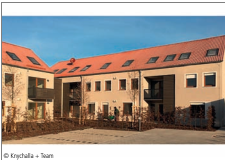
6100-1320 Mehrfamilienhaus (14 WE) Seite 394