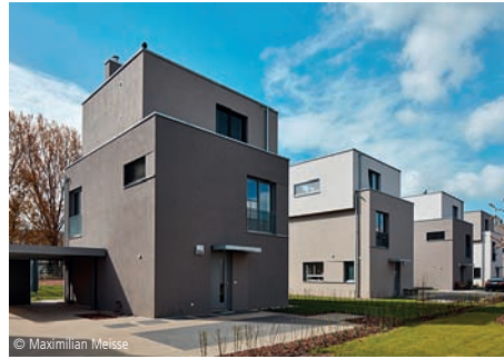
6100-1340 Einfamilienhaus (12 WE)

güldenzipf rohrberg architektur + design Hamburg