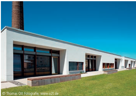
4400-0297 Kindertagesstätte (6 Gruppen, 126 Kinder) Seite 256