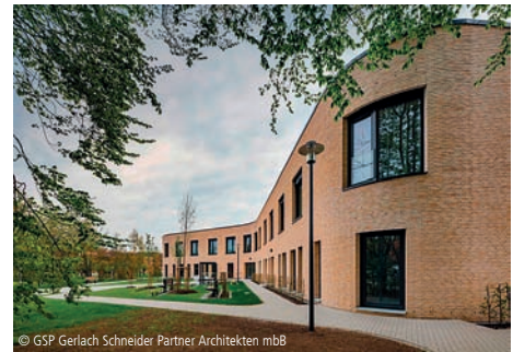
3300-0014 Fachklinik für Psychosomatik