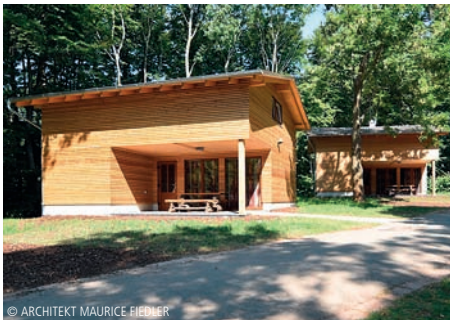
6100-1328 Ferienhaus (Ferienhaussiedlung) Seite 406