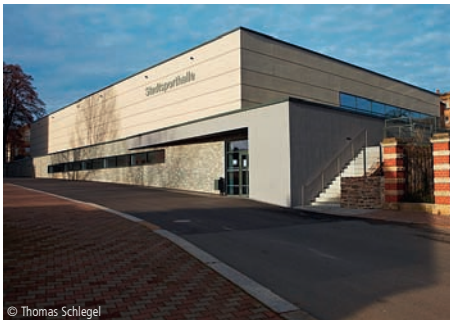
5100-0123 Sporthalle (Zweifeldhalle)