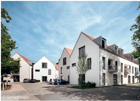
6100-1317 Wohn- und Geschäftshäuser (21 WE), (6 Gewerbe) Seite 382