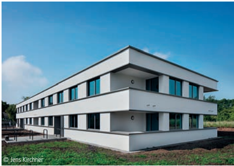
6200-0079 Übergangwohnheim für Flüchtlinge (12 WE) Seite 490

🏠 pagelhenn architekttinnenarchitekt Hilden