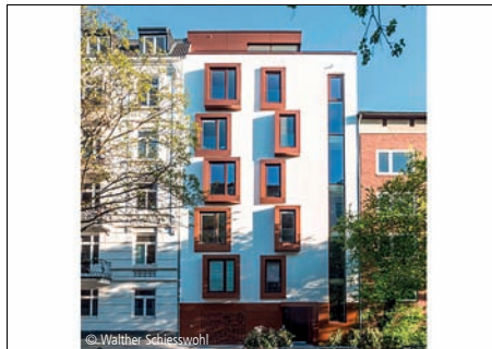
6100-1312 Mehrfamilienhaus (5 WE), TG (5 STP)