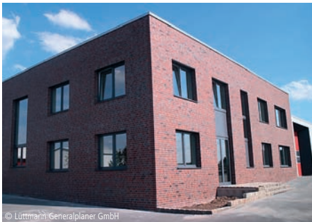
7300-0095 Werkstatteengebäude (17 AP)

🏠 IPROconsult GmbH Planer Architekten Ingenieure Dresden