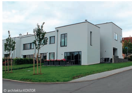
6100-1357 Reihenendhaus, Garage