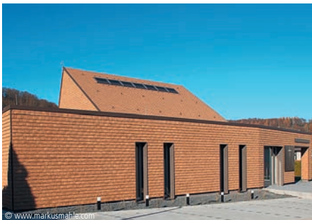
9100-0160 Neuapostolische Kirche

Reiner Maria Löneke Architekten GmbH Berlin