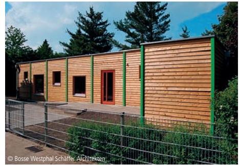
4400-0288 Kinderkrippe (1 Gruppe, 12 Kinder) Modulbau Seite 230

Werkgemeinschaft Quasten-Mundt Grevenbroich