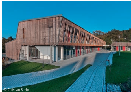
4300-0023 Sonderpädagogisches Förderzentrum Seite 180

🏠 Werkgemeinschaft Quasten-Mundt Grevenbroich