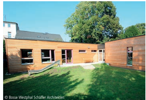
4400-0301 Kindertagesstätte (1 Gruppe, 25 Kinder) Seite 262

raum-z architekten gmbh Frankfurt am Main