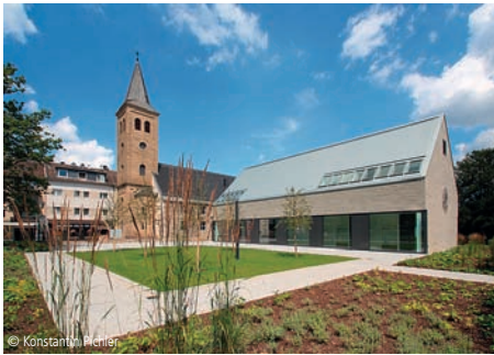
6400-0098 Gemeindehaus (199 Sitzplätze)