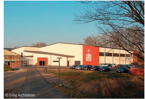
5100-0120 Sporthalle (Zweifeldhalle)