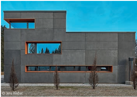
7600-0077 Seminargebäude, Fahrzeughalle