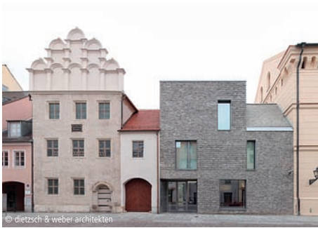
9100-0097 Museum