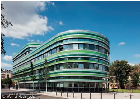
2200-0046 Forschungs- und Laborgebäude (250 AP) Seite 74

Bodamer Faber Architekten BDA (LPH 2-5) Stuttgart