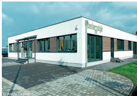
7100-0054 Laborgebäude (23 AP)

🏠 Planungsgemeinschaft blauraum Architekten ASSMANN BERATEN + PLANEN GmbH, Hamburg