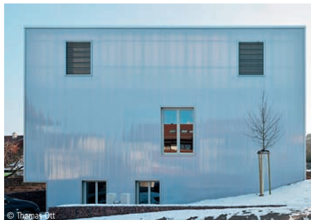
6400-0097 Gemeindehaus