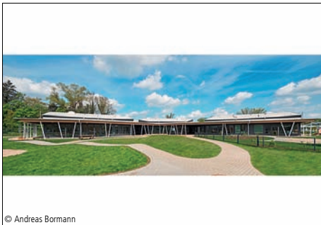
4400-0318 Kindertagesstätte (7 Gruppen, 145 Kinder) Seite 292