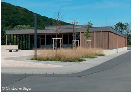
6400-0105 Bürgerhaus