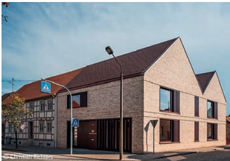
4400-0308 Kindertagesstätte (75 Kinder) Seite 280

kleyer.koblitz.letz.el.freivogel ges. v. architekten mbh Berlin