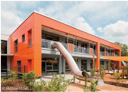
4400-0286 Kindertagesstätte (4 Gruppen, 80 Kinder) Seite 218