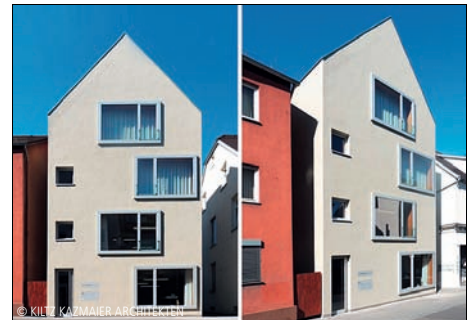
6100-1332 Wohn- und Geschäftshaus (1 WE, 6 AP) Seite 412

🏠 KILTZ KAZMAIER ARCHITECTEN Kirchheim unter Teck