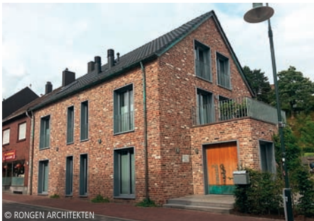
3100-0024 Praxishaus (7 AP) Seite 98

🏠 behet bondzio lin architekten GmbH & Co.KG Münster