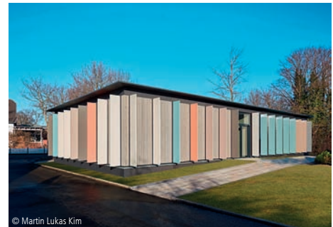
5200-0017 Bewegungsbad

🏠 BAUCONZEPT® PLANUNGSGESELLSCHAFT mbH Lichtenstein/Sachsen