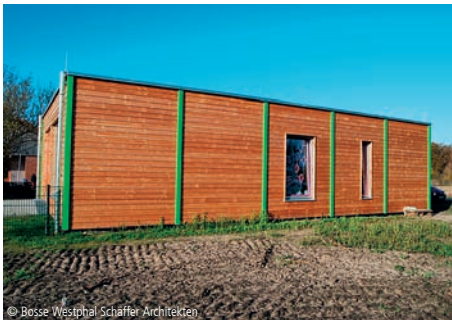
4400-0289 Kindergarten (1 Gruppe, 12 Kinder) Modulbau Seite 240

Bosse Westphal Schäffer Architekten Winsen/Luhe