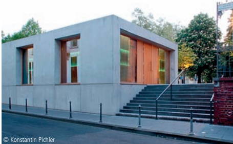
6500-0045 Gaststätte (55 Sitzplätze)