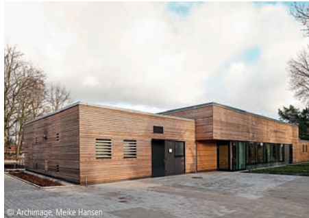
6500-0046 Mensa