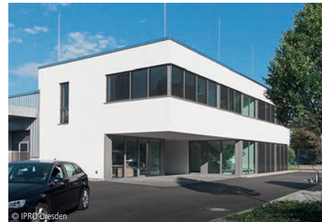
7300-0093 Betriebsgebäude (40 AP)

🏠 N2M Architektur & Stadtplanung GmbH Hannover