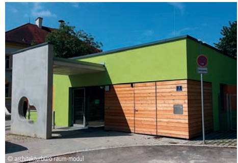
4400-0296 Kindertagesstätte (3 Gruppen, 75 Kinder) Seite 250

Bosse Westphal Schäffer Architekten Winsen/Luhe