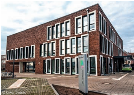
9100-0153 Kreis- und Kommunalarchiv, Bibliothek