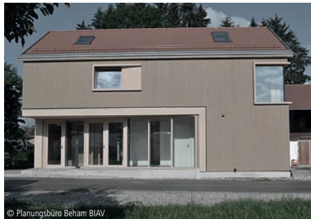
3100-0025 Arztpraxis Seite 104

🏠 RoA RONGEN ARCHITEKTEN PartG mbB Wassenberg