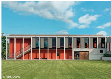
5100-0117 Sporthalle (Einfeldhalle) Seite 298