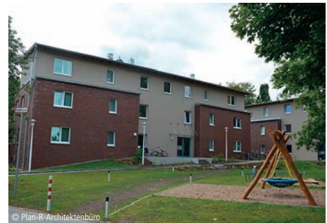
6100-1251 Mehrfamilienhäuser (16 WE)

🏠 BAUCONZEPT® PLANUNGSGESELLSCHAFT mbH Lichtenstein/Sachsen