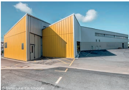
7100-0052 Technologietransferzentrum