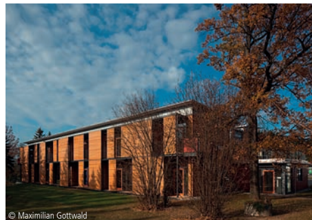
4400-0265 Kinderkrippe (6 Gruppen, 72 Kinder) Seite 206