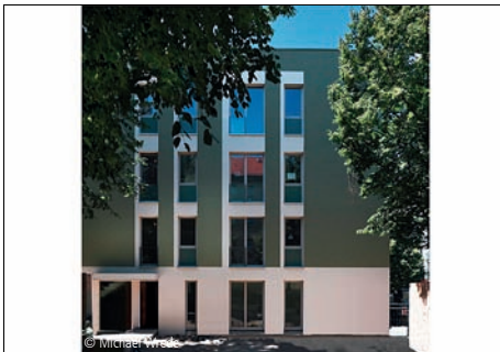
6100-1313 Mehrfamilienhaus (7 WE) - Effizienzhaus 70