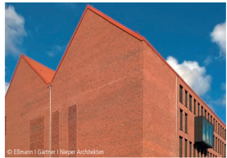
9100-0151 Bibliothek

dietzsch & weber architekten bda Halle (Saale)