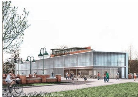
7800-0026 Fahrradparkhaus (450 STP), Laden