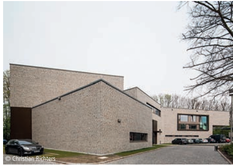
2200-0051 Lehrsaaalgebäude, Institut der Feuerwehr Seite 92

🏠 BHBVT Gesellschaft von Architekten mbH Berlin