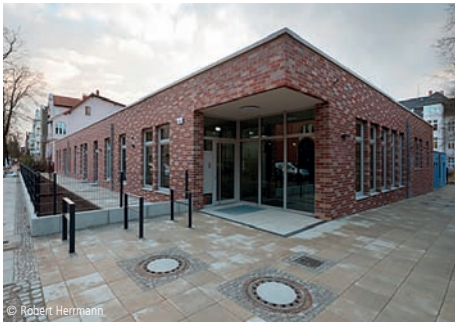
4400-0302 Kindertagesstätte (6 Gruppen, 85 Kinder) Seite 268

LANDHERR / Architekten und Ingenieure GmbH Hoppegarten