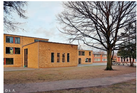
4100-0177 Grundschule (10 Klassen, 280 Schüler)

🏠 Bosse Westphal Schäffer Architekten Winsen/Luhe