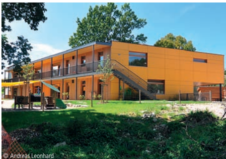
4400-0250 Kinderkrippe (4 Gruppen, 50 Kinder) Seite 194