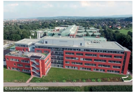
3200-0025 Zentrum für Neurologie und Geriatrie (220 Betten)

🏠 Architekturwerkstatt Bornkessel Hammelburg