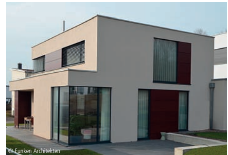
6100-1324 Einfamilienhaus Seite 400