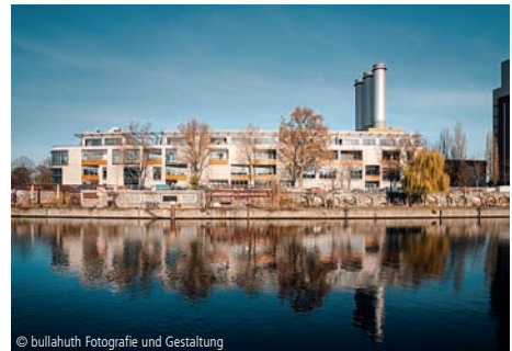
9100-0159 Skulpturenzentrum