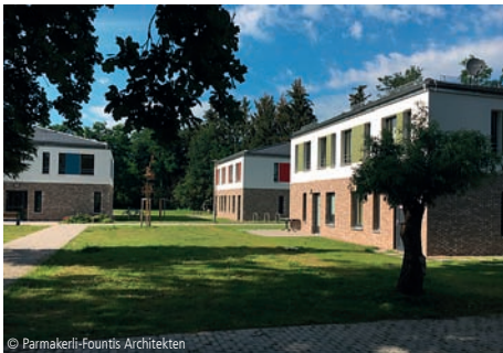
6200-0082 Wohnheim, Jugendhilfe (3 Gebäude) Seite 502

🏠 Parmakerli-Fountis Gesellschaft von Architekten mbH Kleinmachnow