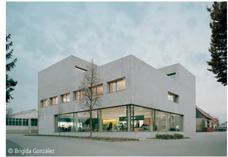
1300-0233 Büro- und Ausstellungsgebäude (32 AP) Seite 56

dt+p Architekten und Ingenieure GmbH Bremen