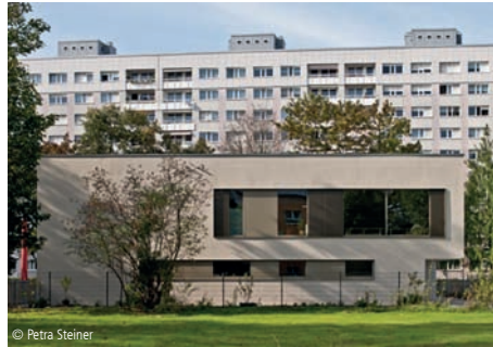
4400-0274 Kindertagesstätte (7 Gruppen, 117 Kinder) Seite 208