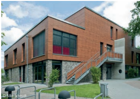
4400-0231 Kindertagesstätte (7 Gruppen, 140 Kinder)

heine I reichold architekten Partnerschaftsgesellschaft mbB, Lichtenstein