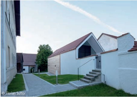
9700-0024 Aufbahrungsgebäude