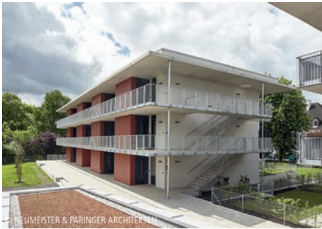
6100-1248 Mehrfamilienhaus (23 WE), TG (31 STP) Seite 422

NEUMEISTER & PARINGER ARCHITEKTEN BDA Landshut