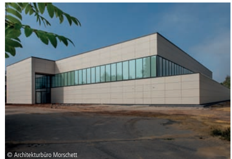
5100-0102 Sporthalle (Dreifeldhalle) Seite 262