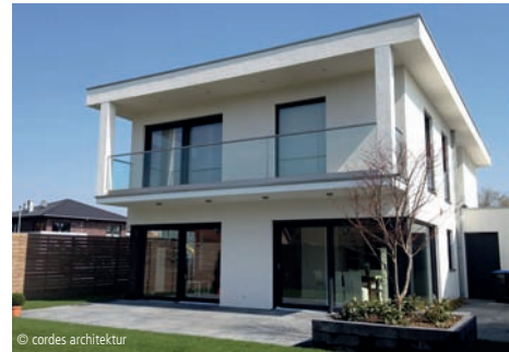
6100-1257 Einfamilienhaus, Garage - Effizienzhaus ~60%