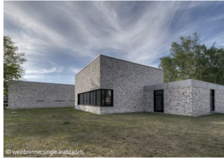
5100-0104 Sporthalle (Dreifeldhalle), Therapiebereich