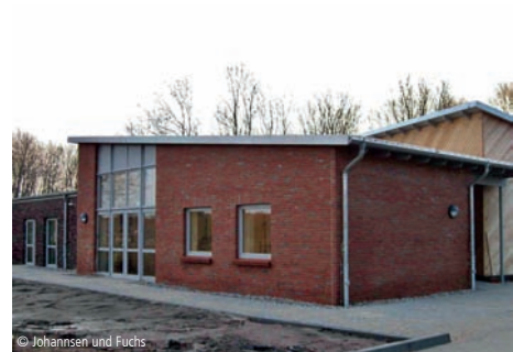
6200-0070 Tagesförderstätte für behinderte Menschen (22 Pflegeplätze) Seite 570

🏠 Ebe | Ausfelder | Partner Architekten München