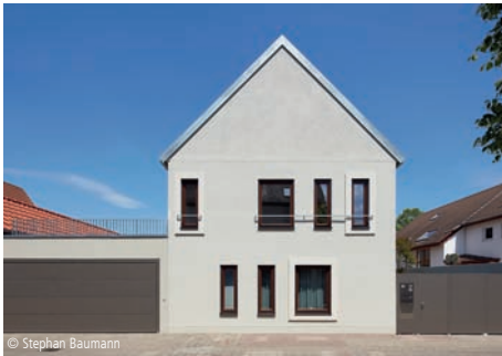
6100-1271 Zweifamilienhaus, Einliegerwohnung, Doppelgarage Seite 506