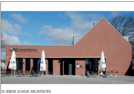
9100-0133 Gemeindezentrum, Restaurant, Pension (10 Betten)

däschler architekten & ingenieure gmbh Halle (Saale)