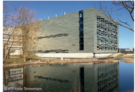
2200-0043 Forschungslabor Mikroelektronik