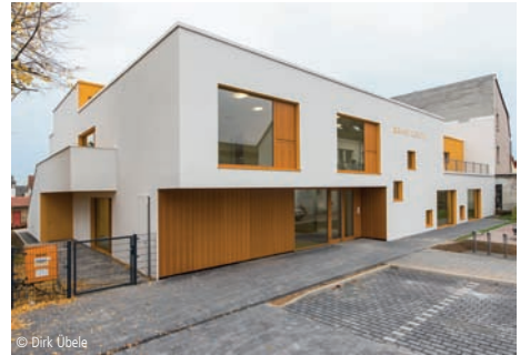
4400-0292 Kindertagesstätte (6 Gruppen, 100 Kinder) Seite 244