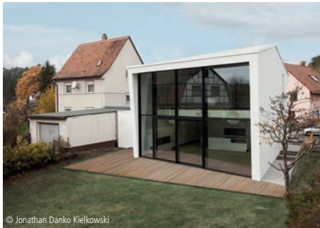
6100-1301 Einfamilienhaus, Garage - Effizienzhaus 85 Seite 542

🏠 biefang | pemsel Architekten GmbH Nürnberg