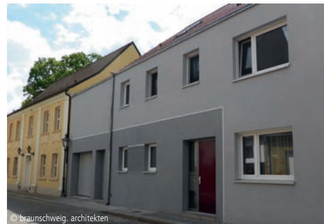
6100-1205 Einfamilienhaus, Garage