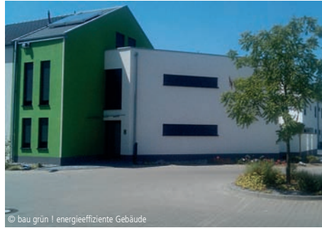
6100-1218 Einfamilienhaus - Effizienzhaus 40 Seite 356