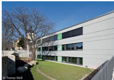
4100-0162 Gesamtschule (10 Klassen, 280 Schüler)

Hüdepohl Ferner Architektur- und Ingenieurges. mbH Osnabrück