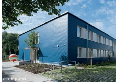
4400-0271 Kinderkrippe (4 Gruppen, 48 Kinder) Seite 196