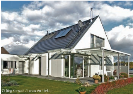
6100-1288 Einfamilienhaus, Garage Seite 518