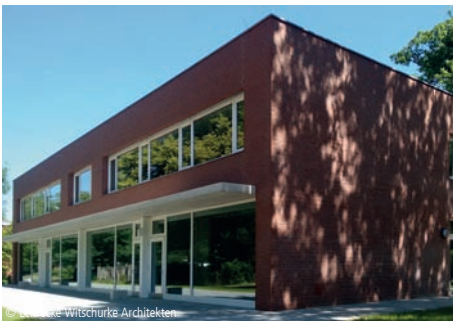
4400-0275 Grundschulhort (300 Kinder) Seite 214