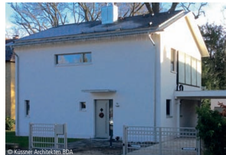
6100-1247 Einfamilienhaus, Carport