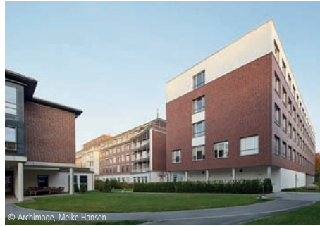
3200-0022 Geriatrie (88 Betten), Tagesklinik (10 Plätze)