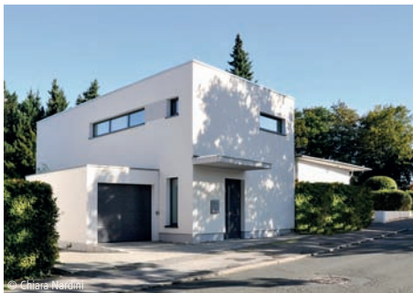
6100-1265 Einfamilienhaus, Garage

🏠 Zweering Helmus Architekten PartGmbH Aachen