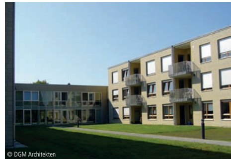
6100-0852 Seniorenwohnungen (18 WE)