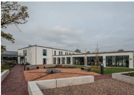
3500-0004 Rehaklinik für suchtkranke Menschen