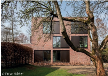
6100-1239 Mehrfamilienhaus (3 WE), TG (3 STP)