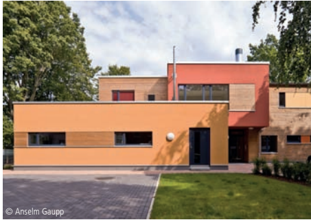
4400-0282 Kindertagesstätte (8 Gruppen, 140 Kinder) barrierefrei Seite 226

🏠 Neustadtarchitekten (LPH 1-5) mit lup-architekten (LPH 6-9), Hamburg