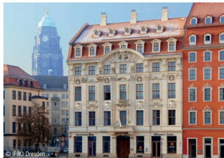
6600-0020 Hotel (76 Betten), Gewerbe