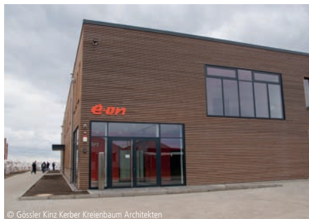
7300-0088 Betriebsgebäude (22 AP) - Helgoland Seite 664