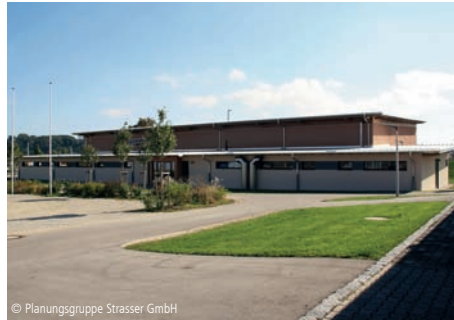
5100-0108 Sporthalle (Zweifeldhalle)

🏠 Stadt Schweinfurt Stadtentwicklungs- und Hochbauamt, Schweinfurt