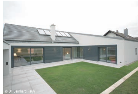
6100-1245 Einfamilienhaus, Doppelgarage

Spengler · Wiescholek Architekten Stadtplaner Hamburg