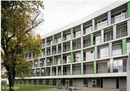
3200-0023 Psychosomatische Klinik (40 Betten)

euroterra GmbH architekten ingenieure Hamburg