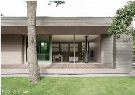
6100-1219 Einfamilienhaus Seite 362