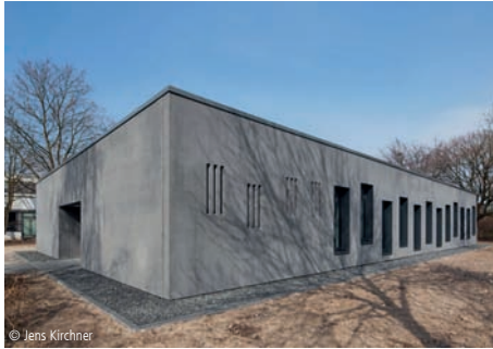
4100-0164 Musikunterrichtsräume (5 Klassen)