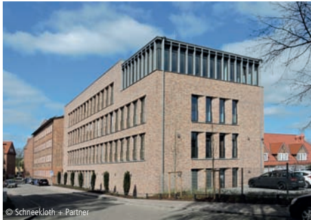
1300-0225 Bürogebäude (44 AP)