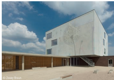
4400-0278 Kindertagesstätte (105 Kinder), Stadteiltreff - Effizienzhaus ~25% Seite 220

🏠 Lehrecke Witschurke Architekten Berlin