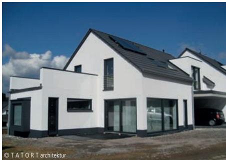
6100-1259 Doppelhaushälfte, Carport