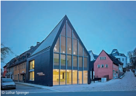
9100-0123 Informations- und Kommunikationszentrum