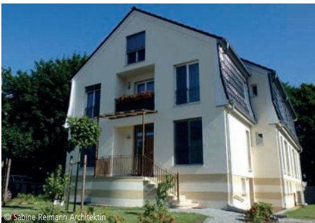
6100-1226 Mehrfamilienhaus (5 WE) Seite 374

🏠 Sturm und Wartzeck GmbH Architekten BDA, Innenarchitekten, Dipperz