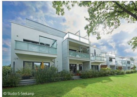
6100-1283 Mehrfamilienhaus (24 WE), TG (20 STP) Seite 512