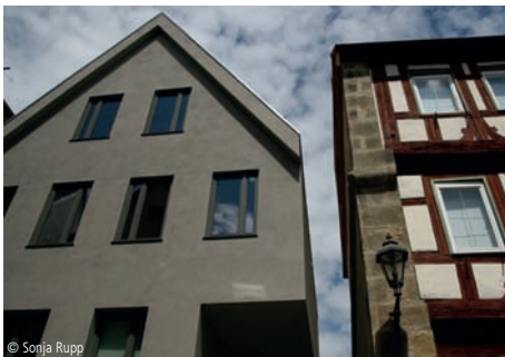
6100-1254 Einfamilienhaus - Effizienzhaus 55 Seite 458