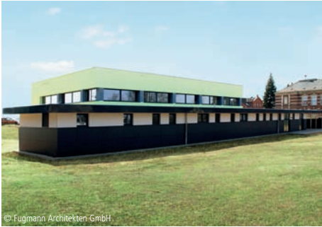
5100-0103 Sporthalle (Einfeldhalle)