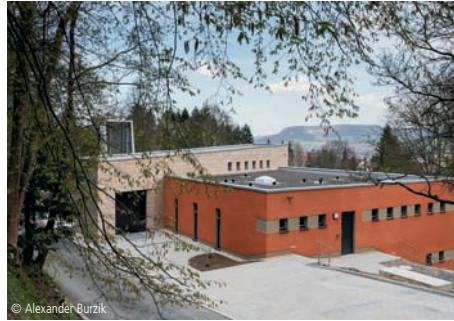
9700-0026 Krematorium