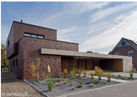
6100-1295 Einfamilienhaus Seite 530

🏠 HGMB Architekten GmbH + Co. KG Düsseldorf