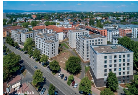
6200-0072 Wohnheimanlage (600 WE), TG (61 STP) Seite 582

🏠 Die Zusammenarbeiter, Gesellschaft von Architekten mbH, Berlin