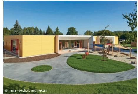
4400-0216 Kinderkrippe (4 Gruppen, 60 Kinder)