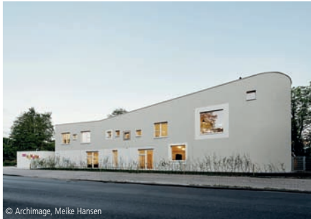
4400-0290 Kindertagesstätte (3 Gruppen, 55 Kinder) Seite 238

🏠 Leinen und Schmitt Architekten Saarlouis