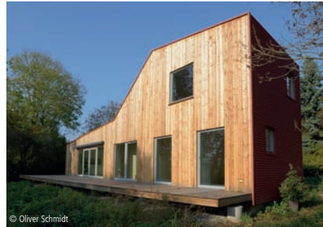
6100-1253 Wochenendhaus Seite 452