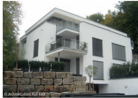
6100-1249 Mehrfamilienhaus (6 WE), TG (6 STP) Seite 434

NEUMEISTER & PARINGER ARCHITEKTEN BDA Landshut