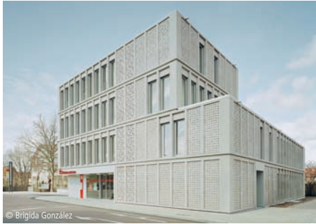
1300-0220 Bürogebäude, Bankfiliale (26 AP)