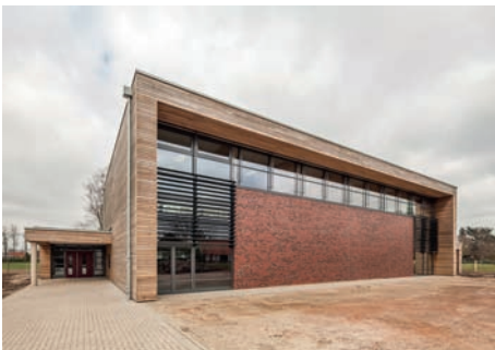
5100-0110 Sporthalle (Einfeldhalle) - Passivhaus

🏠 Planungsgruppe Strasser GmbH Traunstein