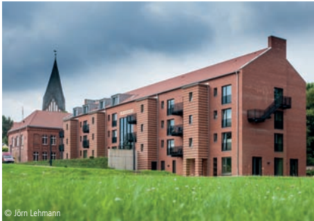
6100-1250 Mehrfamilienhaus, altengerecht (29 WE) Seite 440