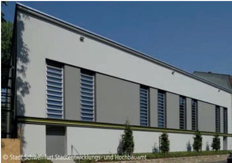
5100-0105 Sporthalle (Zweifeldhalle)

🏠 weinbrenner.single.arabzadeh. architektenwerkgemeinschaft, Nürtingen