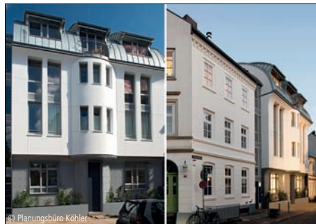
6100-1233 Wohn- und Geschäftshaus (3 WE) Seite 380