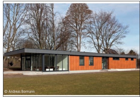
5300-0013 Sport- und Vereinsheim