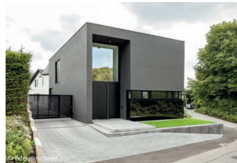
6100-1260 Einfamilienhaus - Effizienzhaus ~33%