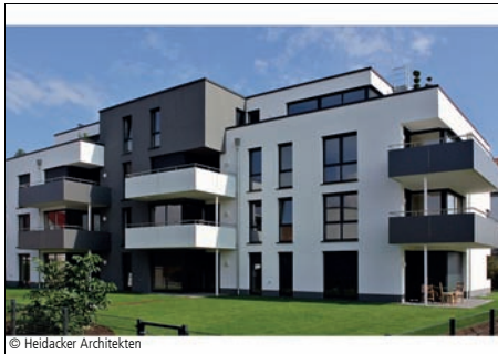
6100-1235 Mehrfamilienhaus (11 WE), TG (14 STP)