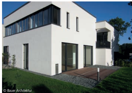
6100-1296 Doppelhaus (2 WE) Seite 536

🏠 Hartmann-Eberlei Architekten Oldenburg