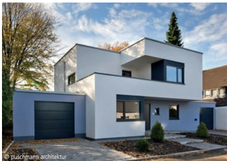
6100-1096 Einfamilienhaus, Garagen