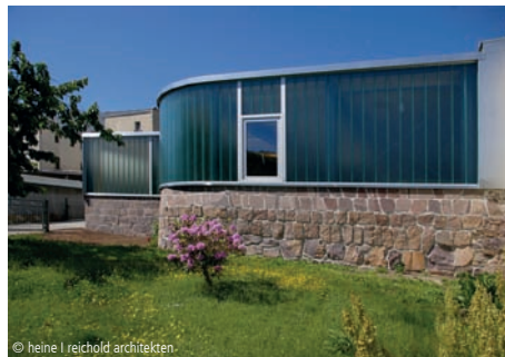
7700-0062 Mehrzweckhalle, Fahrradgeschäft