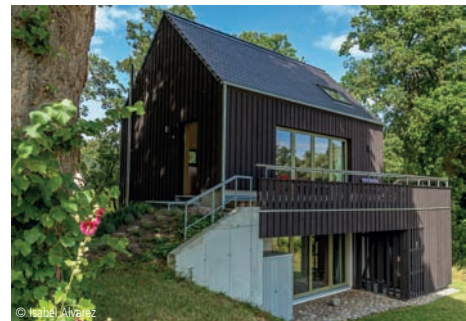
6100-1266 Ferienhaus

🏠 SCHAMP & SCHMALÖER Architekten Stadtplaner PartGmbH, Dortmund