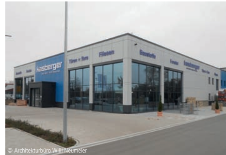
7200-0088 Baufachmarkt, Ausstellungsgebäude Seite 640

🏠 °pha design Banniza, Hermann, Öchsner und Partner Potsdam