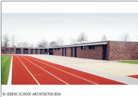
5300-0014 Sanitär- und Umkleidegebäude