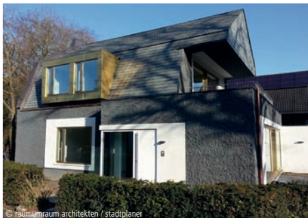
6100-1246 Zweifamilienhaus, Garage