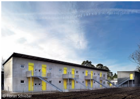
6200-0069 Wohnungen für obdachlose Menschen (14 Wohnungen, 32 Betten) Seite 564

🏠 Michel + Wolf + Partner Freie Architekten BDA Stuttgart