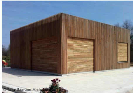
6500-0042 Kiosk, Kanuverleih