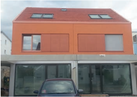
6100-1208 Doppelhaushälfte - Effizienzhaus 70 Seite 350