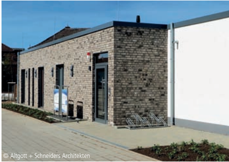
3100-0021 Praxis für Allgemeinmedizin