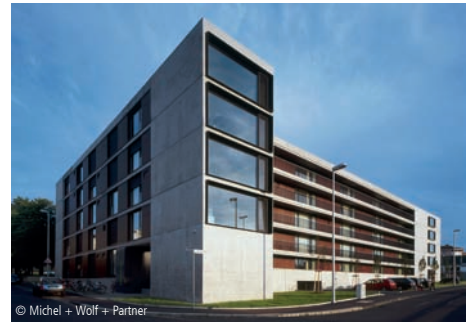
6200-0057 Studentenwohnheim (139 Betten), TG (38 STP) Seite 548

🏠 biefang | pemsel Architekten GmbH Nürnberg