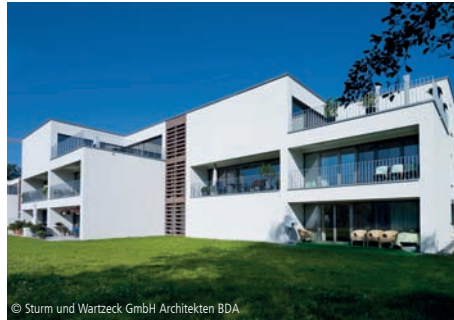
6100-1222 Wohnanlage (44 WE), TG (48 STP) Seite 368

🏠 Sturm und Wartzeck GmbH Architekten BDA, Innenarchitekten, Dipperz