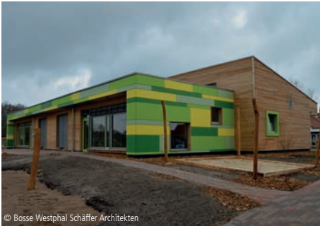
4400-0273 Kinderkrippe (2 Gruppen, 30 Kinder) Seite 202