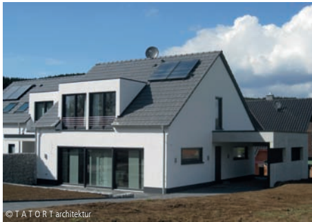
6100-1256 Doppelhaushälfte, Carport