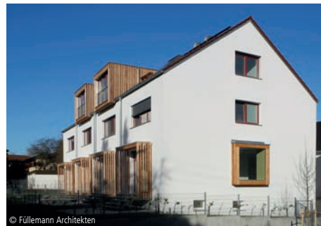
6100-1255 Reihenhäuser (4 WE) Seite 464