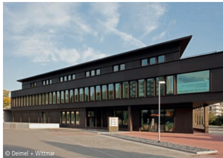
7200-0089 Ärzte- und Geschäftshaus, TG (22 STP) Seite 646