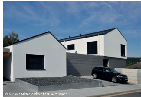
6100-1238 Wohnhäuser (2 WE), Garage