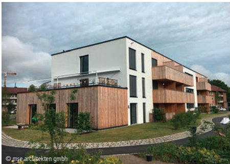
6200-0087 Wohnheim für Menschen mit Behinderung (26 WE) - Effizienzhaus ~16% Seite 680 mse architekten gmbh Kaufbeuren