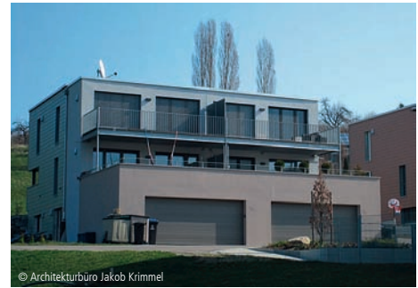
6100-1349 Doppelhäuser (2 WE) - Effizienzhaus 55 Seite 506

🏠 Architekturbüro Jakob Krimmel Bermatingen