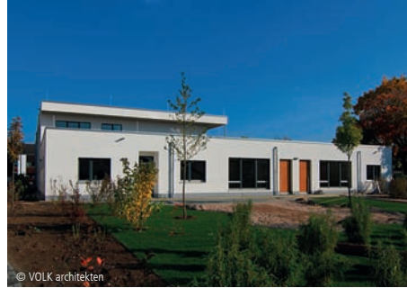
4400-0305 Kindertagesstätte (125 Kinder) - Passivhaus Seite 252