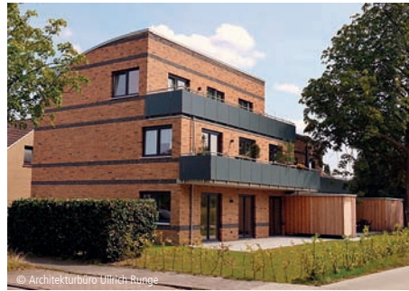
6100-1398 Mehrfamilienhaus (5 WE) - Effizienzhaus 70 Seite 626

🏠 Architekturbüro Ullrich Runge Delmenhorst