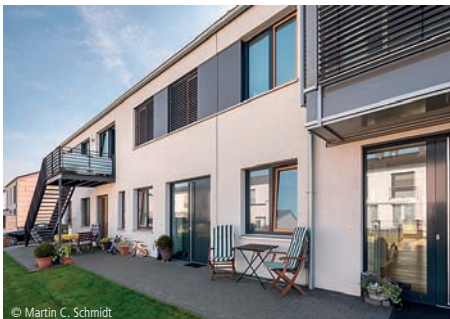
6100-1356 Mehrfamilienhaus (3 WE) - Effizienzhaus 70 Seite 524