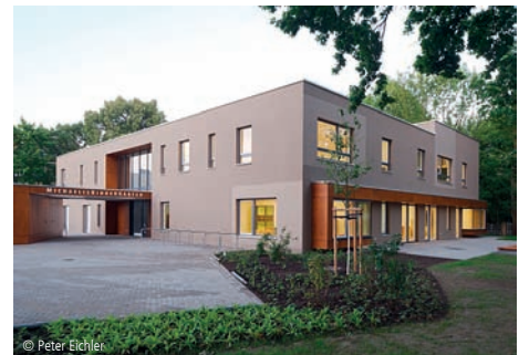
4400-0299 Kindertagesstätte (108 Kinder) - Effizienzhaus ~79% Seite 240 ☞ wittig brösdorf architekten Leipzig