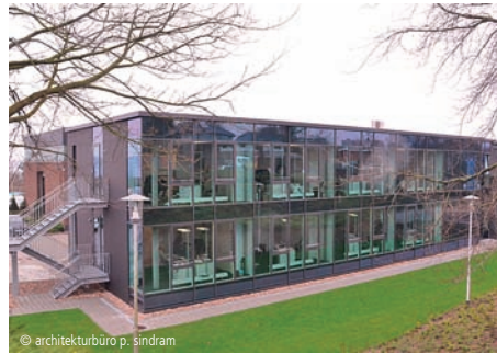
1300-0252 Verwaltungsgebäude (34 AP) - Effizienzhaus ~25% Seite 136