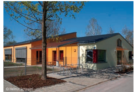
4400-0293 Kinderkrippe (3 Gruppen, 36 Kinder) - Effizienzhaus ~37% Seite 216 ☞ Architekturbüro Schwalm Karlsruhe