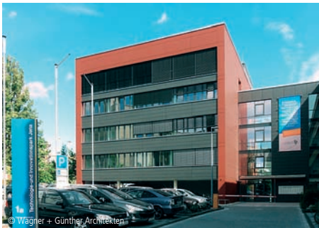
1300-0239 Technologiezentrum - Effizienzhaus ~62% Seite 100