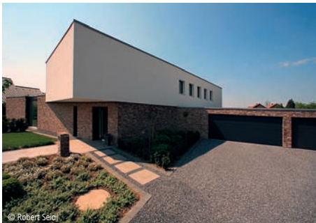
6100-1335 Einfamilienhaus, Garagen - Passivhaus