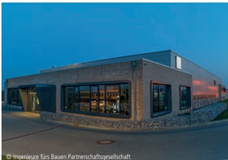
© Ingenieure fürs Bauen Partnerschaftsgesellschaft 7300-0090 Bäckerei, Verkaufsraum - Effizienzhaus ~73% Seite 730 Ingenieure fürs Bauen Partnerschaftsgesellschaft Gettorf