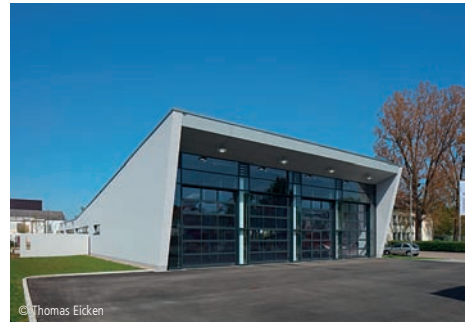
7600-0076 Feuerwehrgerätehaus, Übungsturm - Passivhaus Seite 764

🏠 Lengfeld & Wilisch Architekten PartG mbB Darmstadt