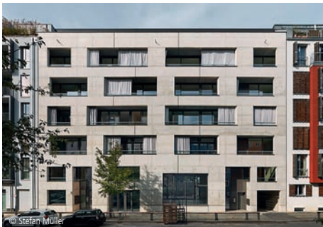
6100-1341 Wohn- u. Geschäftshaus - Effizienzhaus ~56% Seite 476 🏠 roedig . schop architekten PartG mbB Berlin