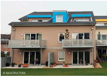
6100-1359 Mehrfamilienhaus (6 WE) - Effizienzhaus 55 Seite 536