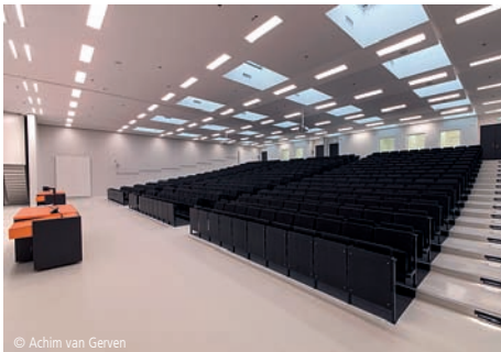
2100-0001 Hörsaalgebäude (3 Hörsäle) - Effizienzhaus ~69% Seite 150