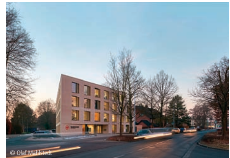
1300-0246 Bürogebäude, Kanzlei (60 AP) - Effizienzhaus ~72% Seite 124

🏠 Schmidtman und Gölling Architektur- und Ingenieur- gesellschaft mbH, Berlin