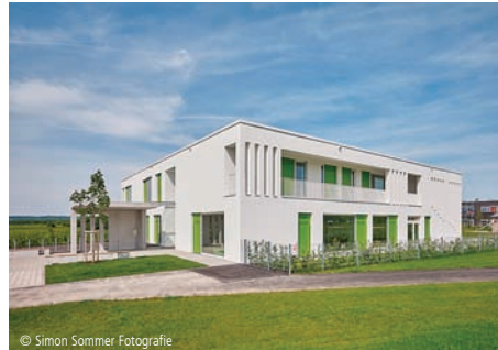
4400-0309 Kindertagesstätte (100 Kinder) - Effizienzhaus ~55% Seite 270

🏠 wagner + ewald architekten Ginsheim-Gustavsburg