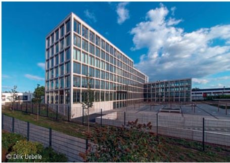
1300-0248 Bürogebäude (405 AP) - Effizienzhaus ~75% Seite 130