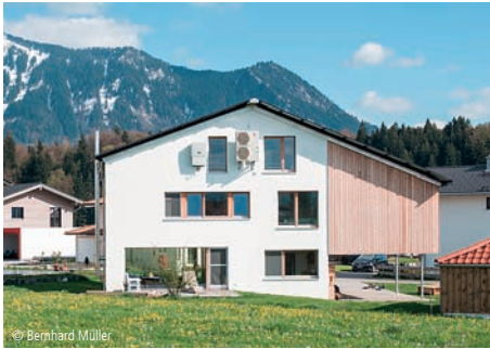
6100-1325 Einfamilienhaus - Effizienzhaus 40