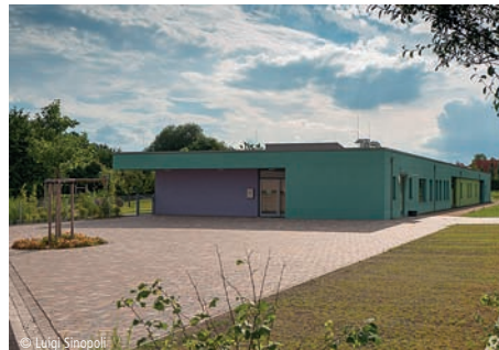
4400-0312 Kindertagesstätte (90 Kinder) - Effizienzhaus ~50% Seite 282

🏠 Kemper Steiner & Partner Architekten GmbH Bochum