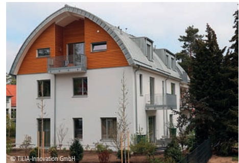
6100-1337 Mehrfamilienhaus (5 WE) - Effizienzhaus ~33%

🏠 RoA Rongen Architekten PartG mbB Wasserberg