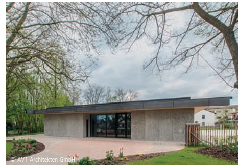
6200-0088 Tagespflege, Demenzerkrankte - Effizienzhaus ~62% Seite 686 AV1 Architekten GmbH Kaiserslautern