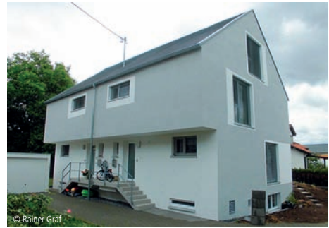
6100-1369 Doppelhaushälfte - Effizienzhaus 40 Seite 578