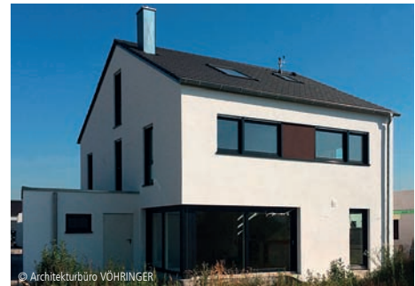
6100-1331 Einfamilienhaus, Garagen (2St) - Effizienzhaus ~64%