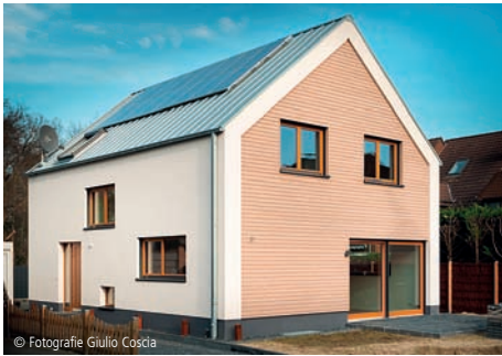
6100-1289 Einfamilienhaus, Garage - Effizienzhaus ~31% Seite 348