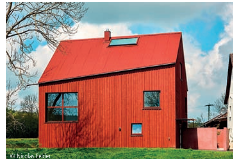
6100-1358 Einfamilienhaus - Effizienzhaus 70 Seite 530