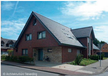
6100-1310 Mehrfamilienhaus (5 WE) - Effizienzhaus 70 Seite 372