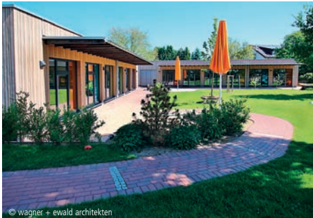
4400-0307 Kindertagesstätte (4 Gruppen) - Effizienzhaus ~60% Seite 258