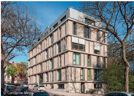
6100-1330 Mehrfamilienhaus (24 WE), TG - Effizienzhaus ~16%

🏠 RoA RONGEN ARCHITEKTEN PartG mbB Wasserberg