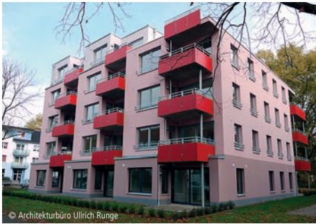
6100-1397 Mehrfamilienhaus (23 WE) - Effizienzhaus ~67% Seite 620

🏠 Architekturbüro Ullrich Runge Delmenhorst