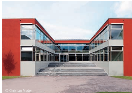
4100-0168 Realschule (400 Schüler) - Effizienzhaus ~66% Seite 158

🏠 Eßmann | Gärtner | Nieper Architekten GbR Leipzig