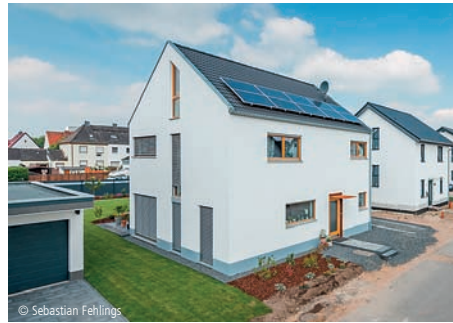
6100-1360 Einfamilienhaus, Garage - Passivhaus Seite 542