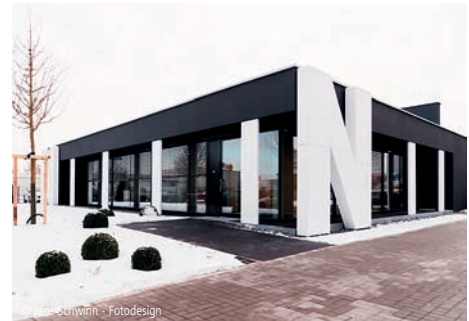
1300-0238 Bürogebäude, Lagerhalle - Effizienzhaus 70 Seite 94