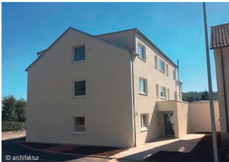
6100-1381 Flüchtlingsunterkunft (6 WE) - Effizienzhaus 70 Seite 602