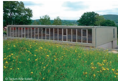
5100-0115 Sporthalle (Einfeldhalle) - Effizienzhaus ~68% Seite 316

🏠 Tectum Hille Kobelt Architekten BDA Weimar