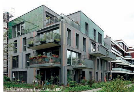
6100-1186 Mehrfamilienhaus (9 WE) - Effizienzhaus Plus Seite 336

🏠 Baufrosche Architekten und Stadtplaner GmbH Kassel