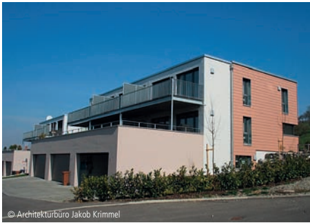
6100-1348 3 Reihenhäuser - Effizienzhaus 55 Seite 500

🏠 Architekturbüro Jakob Krimmel Bermatingen