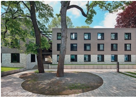
6200-0083 Studentenwohnheim, Verwaltung - Effizienzhaus ~26% Seite 668 ACMS Architekten GmbH Wuppertal