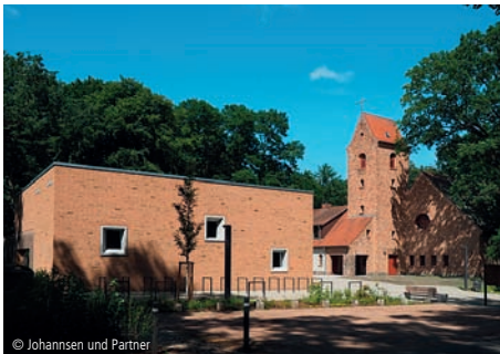
9100-0156 Chor- und Gemeindehaus - Effizienzhaus ~68% Seite 772

🏠 Lengfeld & Wilisch Architekten PartG mbB Darmstadt