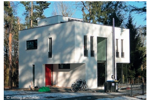
6100-1354 Einfamilienhaus - Effizienzhaus ~73% Seite 518

🏠 Sprenger Architekten und Partner mbB Hechingen