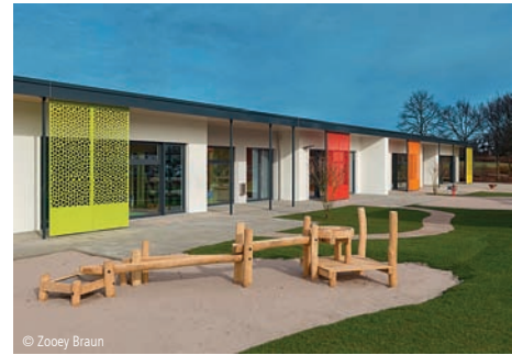
4400-0316 Kindertagesstätte (5 Gruppen) - Effizienzhaus ~67% Seite 294