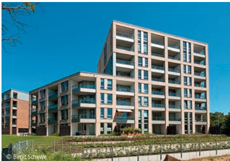
6100-1362 Mehrfamilienhäuser (66 WE) - Effizienzhaus 70 Seite 548