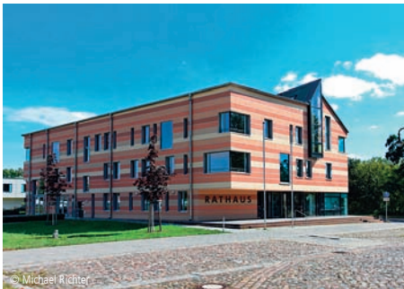
1300-0242 Rathaus (55 AP) - Passivhaus Seite 118