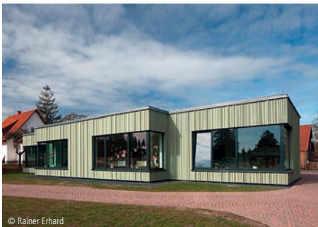
4400-0298 Hort (2 Gruppen, 40 Kinder) - Effizienzhaus ~30% Seite 228 ☞ ralf pohlmann architekten Waddeweitz