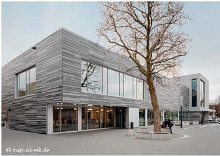
6500-0047 Mensa Unterrichtsräume (8 Klassen) (256 Schüler) - Passivhaus Seite 704 (pfitzner moorkens) architekten Hannover