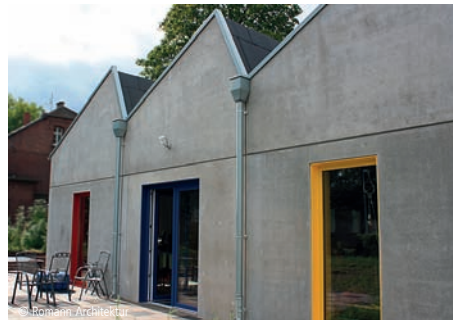
6100-1363 Einfamilienhaus - Effizienzhaus 70 Seite 554

Architekten Asmussen + Partner GmbH Flensburg