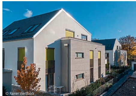
6100-1424 Mehrfamilienhaus (10 WE), TG - Effizienzhaus ~20% Seite 638