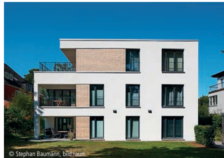
6100-1311 Mehrfamilienhaus (4 WE), TG - Effizienzhaus ~55% Seite 378