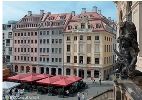
7200-0093 Wohn-/Geschäftshaus, Gastronomie, Hotel - Effizienzhaus ~48% Seite 724 IPROconsult GmbH Planer Architekten Ingenieure Dresden