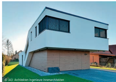
6100-1435 Einfamilienhaus mit Garage - Effizienzhaus 55 Seite 656

🏠 Rongen Architekten PartG mbB Wassenberg