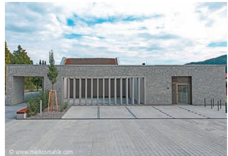
9100-0161 Kirche - Effizienzhaus ~79%

🏠 Architekten Johannsen und Partner Hamburg