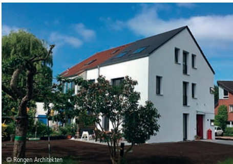
6100-1426 Doppelhaushälfte - Passivhaus Seite 644

🏠 Rongen Architekten PartG mbB Wassenberg