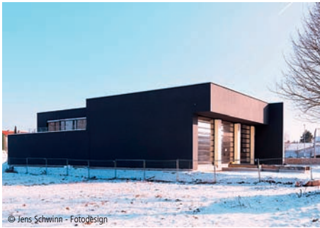
7600-0075 Feuerwehrgerätehaus - Effizienzhaus 70 Seite 758