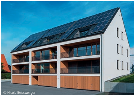
6100-1353 Mehrfamilienhaus (8 WE) - Effizienzhaus 70 Seite 512