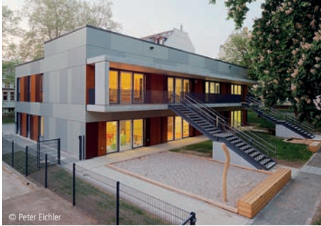
4400-0300 Kindertagesstätte (6 Gruppen, 102 Kinder) - Effizienzhaus ~61% Seite 246