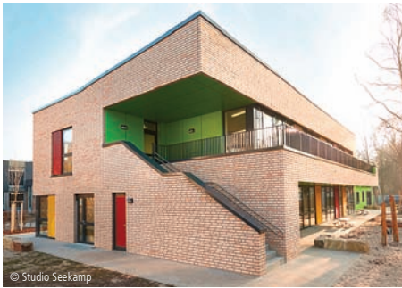
4400-0313 Kindertagesstätte (60 Kinder) - Passivhaus Seite 288