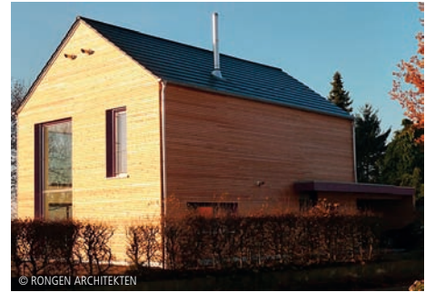
6100-1326 Einfamilienhaus, Carport - Passivhaus