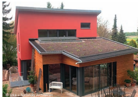
6100-1365 Einfamilienhaus - Effizienzhaus 40 Seite 566

Jirka + Nadansky Architekten Hohen Neuendorf