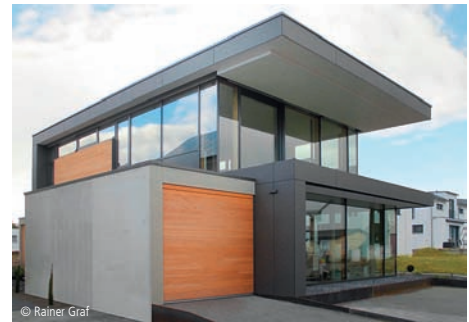
1300-0240 Einfamilienhaus, Büro - Effizienzhaus 40 PLUS Seite 106