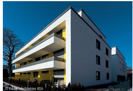
6100-1380 Mehrfamilienhaus (25 WE) - Passivhaus Seite 596