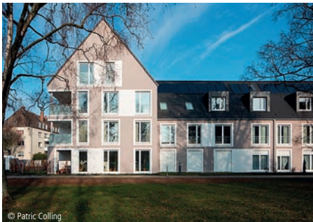
6100-1371 Mehrfamilienhäuser (57 WE) - Effizienzhaus ~34% Seite 590