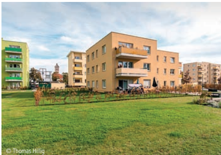
6100-1321 Wohnanlage (101 WE), TG - Effizienzhaus 70 Seite 392

🏠 Leistner Fahr Architektenpartnerschaft Reinbek