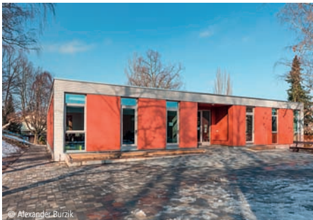
4100-0174 Gesamtschule (10 Klassen, 188 Schüler) - Effizienzhaus ~66% Seite 172

🏠 KBK Architektengesellschaft Belz | Lutz mbH Stuttgart