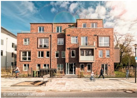
6100-1366 Mehrfamilienhaus (20 WE) - Effizienzhaus 40 Seite 572