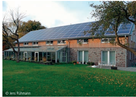
6100-1294 Mehrfamilienhaus (3WE) -Effizienzhaus 40 Seite 360