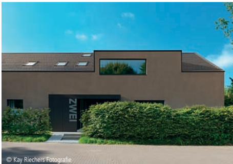
6100-1420 Zweifamilienhaus, Garage - Effizienzhaus 40 Plus Seite 632