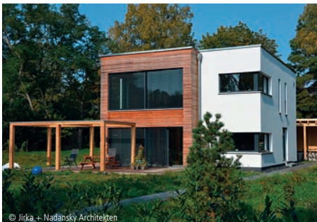
6100-1364 Einfamilienhaus - Effizienzhaus 55 Seite 560

Jirka + Nadansky Architekten Hohen Neuendorf