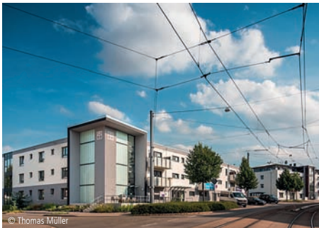
6200-0090 Seniorengerechtes Wohnen - Effizienzhaus 70 Seite 692 WOLFF Architekten & Ingenieure Erfurt