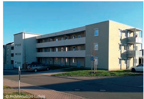
6100-1388 Mehrfamilienhaus (21 WE) - Effizienzhaus ~76% Seite 608