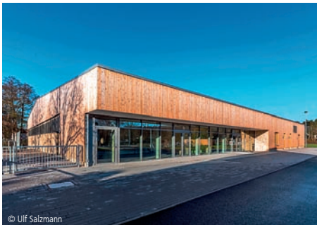
5100-0119 Sporthalle (Dreifeldhalle) - Effizienzhaus ~37% Seite 328