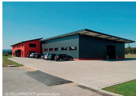
7300-0091 Produktionshalle, Büros - Effizienzhaus ~76% Seite 744 STELLWERKSTATT architekturbüro Detmold