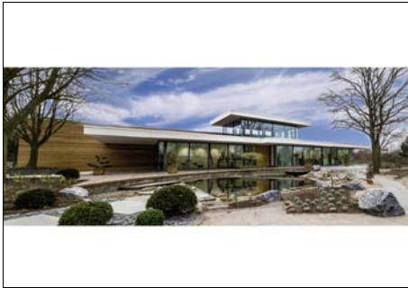
1300-0210 Büro- / Präsentationsgebäude (6 AP) Seite 100