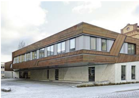
1300-0202 Verwaltungsgebäude (30 AP) Seite 72

Hampel Kotzur & Kollegen Architekten Ingenieure GmbH, Cottbus