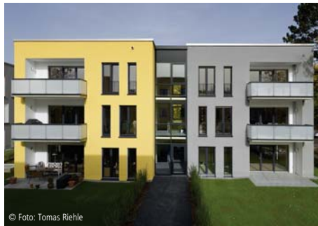
6100-1081 Klimaschutzsiedlung (35 WE), TG Seite 360

Architekturbüro Augustin & Imkamp Leipzig