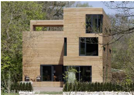
6100-1094 Einfamilienhaus - Effizienzhaus 70 Seite 408