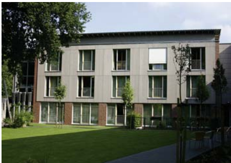
3400-0021 Altenpflegeheim - Passivhaus Seite 116