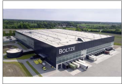
7700-0071 Logistikhalle, Hochregallager Seite 834