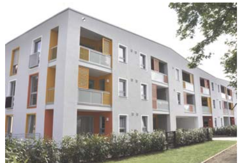
6100-1075 Mehrfamilienhaus - Effizienzhaus 70 Seite 336

Werkgemeinschaft Quasten-Mundt Grevenbroich