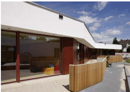
4400-0220 Kindertagesstätte (5 Gr., 70 Ki.) Seite 174

IPRO Dresden Planungs- und Ingenieuraktiengesellschaft, Dresden