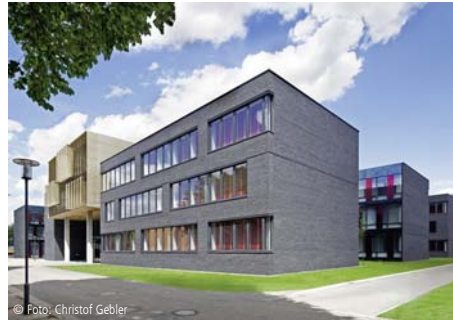
2200-0040 Instituts- und Bibliotheksgebäude Seite 108