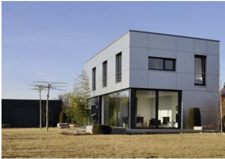
6100-1100 Einfamilienhaus, Garage - KfW 60 Seite 424