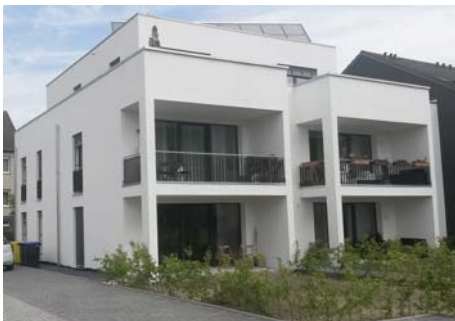
6100-1134 Mehrfamilienhaus - Passivhaus Seite 544