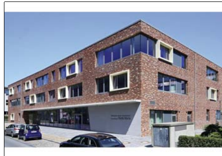
4100-0147 Grundschule (12 Kl., 288 Schüler) Seite 128