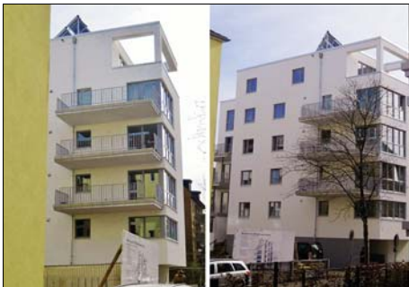
6100-1108 Mehrfamilienhaus - Effizienzhaus 40 Seite 448