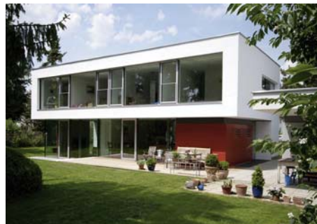
6100-1135 Einfamilienhaus - Effizienzhaus 55 Seite 554