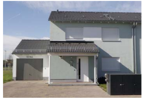
6100-1115 Doppelhaushälfte - Effizienzhaus 70 Seite 466