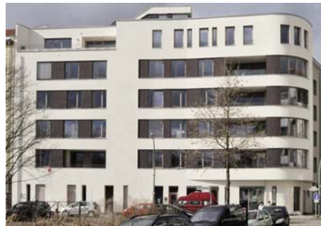
6100-1161 Mehrfamilienhaus - Effizienzhaus 70 Seite 642