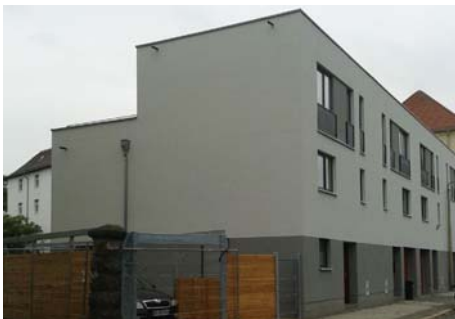
6100-1065 Reihendhaus - Effizienzhaus 85 Seite 294

🏠 pfeifer deegen architekten Berlin-Kreuzberg