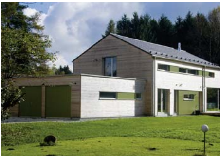
6100-1042 Einfamilienhaus - Passivhaus Seite 244