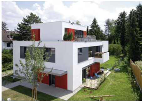
6100-1136 Mehrfamilienhaus - Effizienzhaus 70 Seite 560