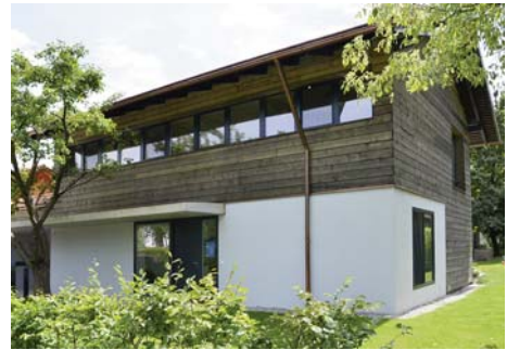
6100-1140 Einfamilienhaus - Effizienzhaus 70 Seite 566