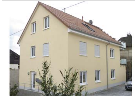
6100-1059 Mehrfamilienhaus - Effizienzhaus 85 Seite 274