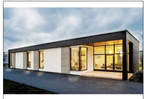
1300-0203 Bürogebäude (17 AP) Seite 78

Hampel Kotzur & Kollegen Architekten Ingenieure GmbH, Cottbus