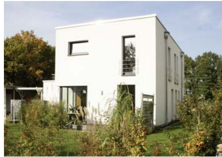
6100-1174 Einfamilienhaus - Effizienzhaus 70 Seite 698