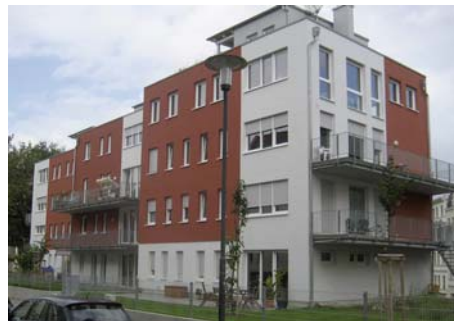
6100-1157 Mehrfamilienhaus - Effizienzhaus 70 Seite 626

⌂ Architekturbüro Thyroff-Krause Kaltenkirchen