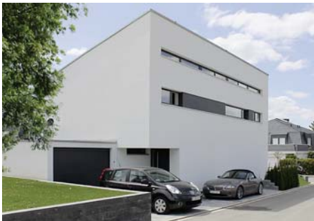
6100-1178 Einfamilienhaus - Passivhaus Seite 724