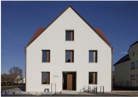
6400-0083 Pfarrhaus, Doppelgarage Seite 784