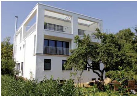
6100-1175 Mehrfamilienhaus - Passivhaus Erweiterung Seite 704