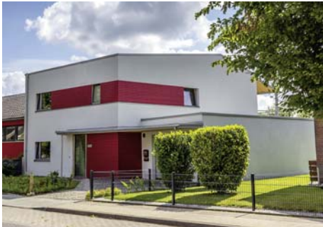
6100-1058 Doppelhaushälfte - Passivhaus Seite 268