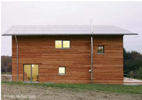
6100-1103 Einfamilienhaus - Effizienzhaus 85 Seite 436