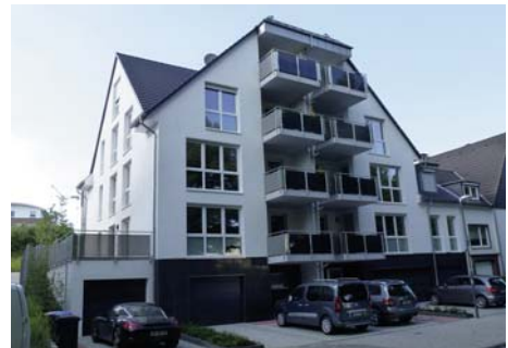
6100-1119 Mehrfamilienhaus - Effizienzhaus 70 Seite 486