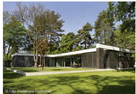
6100-1121 Einfamilienhaus - Effizienzhaus 70 Seite 498