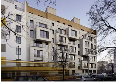
6100-1183 Mehrfamilienhaus - Passivhaus Seite 744

Deimel Oelschläger Architekten Partnerschaft Berlin