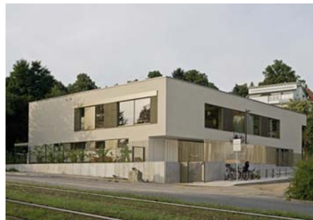
4400-0236 Kindertagesstätte (7 Gr., 117 Ki.) Seite 220

🏠 Birk Heilmeyer und Frenzel Gesellschaft von Architekten mbH, Stuttgart