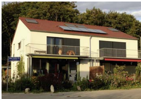
6100-1149 Doppelhaus - Effizienzhaus 55 Seite 588

🏠 Werkgruppe Freiburg Architekten Freiburg