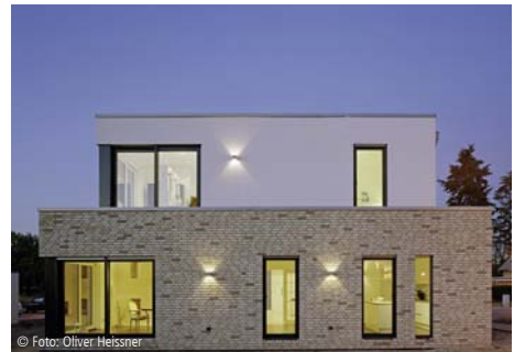
6100-1049 Einfamilienhaus - Effizienzhaus 85 Seite 250