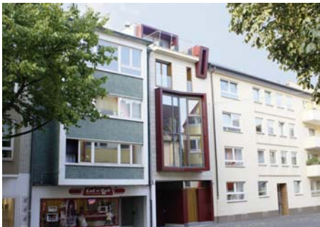
6100-1071 Einfamilienhaus - Effizienzhaus 85 Seite 318