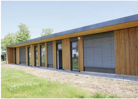
4400-0237 Kindertagesstätte (4 Gr., 36 Ki.) Seite 226

dreier + lauterbach architekten und ingenieure gmbh München