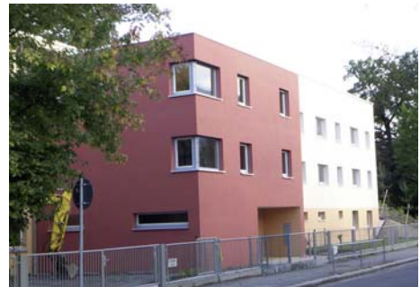
4400-0160 Kinder- und Jugendhaus Seite 164