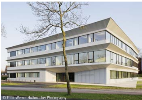
7100-0047 Büro- und Laborgebäude Seite 816

Angelis & Partner Architekten mbB Oldenburg