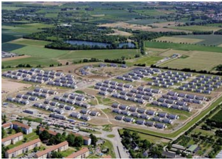
6100-1114 Wohnanlage (326 WE) Seite 460