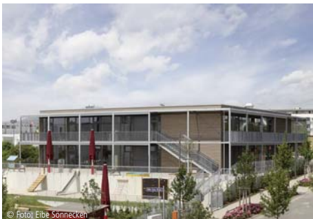
4400-0234 Kindertagesstätte - Passivhaus Seite 214

🏠 müllerschurr.architekten Marktoberdorf