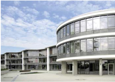
4100-0154 Gesamtschule (750 Kinder) Seite 146