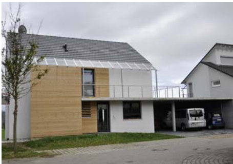
6100-1082 Einfamilienhaus - Effizienzhaus 55 Seite 368

Druschke und Grosser Architekten BDA Duisburg