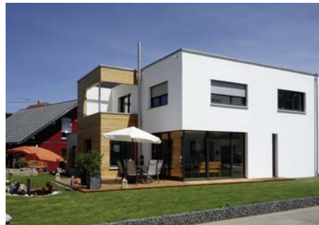
6100-1177 Einfamilienhaus - Passivhaus Seite 714