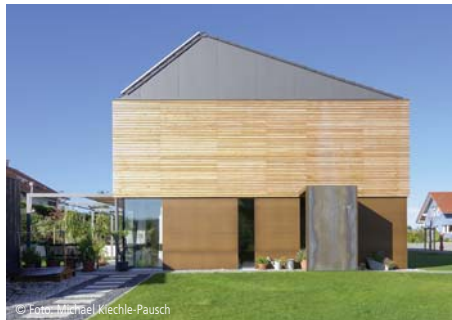
6100-1109 Einfamilienhaus - Passivhaus Seite 454