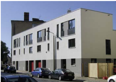
6100-1079 Reihenhäuser - Effizienzhaus 85 Seite 354

Druschke und Grosser Architekten BDA Duisburg