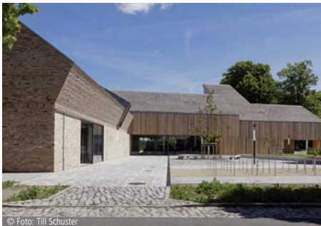
9100-0098 Naturparkzentrum, Agrarmuseum Seite 842