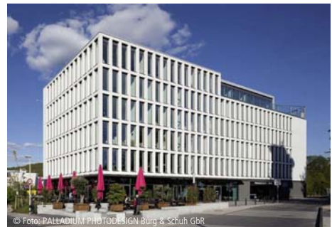
1300-0205 Bürogebäude (100 AP) Seite 90

P6 architekteningenieure BSC Bauplanung Sachsen Consult GmbH & Co KG, Dresden