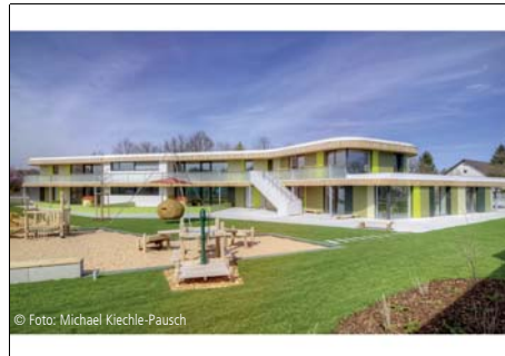
4400-0233 Kinderkrippe - Passivhaus Seite 208

🏠 Architekturbüro Werner Grannemann Bremerhaven