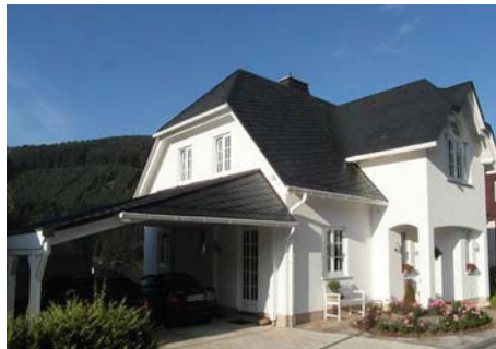
6100-1083 Einfamilienhaus - Effizienzhaus 70 Seite 378

Werkgruppe Freiburg Architekten Freiburg