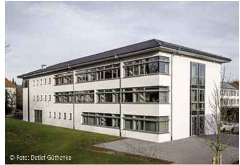
1300-0201 Bürogebäude (39 AP) Seite 66