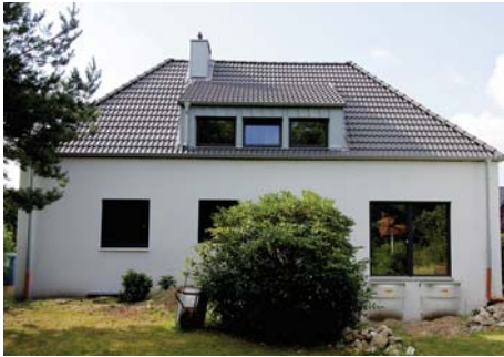
6100-1153 Einfamilienhaus - Effizienzhaus 70 Seite 604 Modernisierung