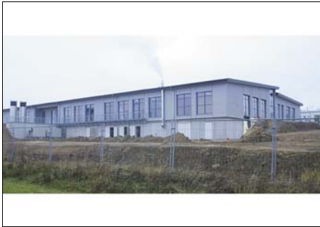
7300-0086 Werkstatt f. Menschen m. Behinderung Seite 828