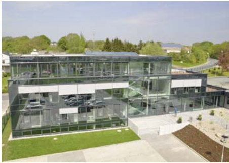
1300-0199 Verwaltungsgebäude (48 AP) Seite 56