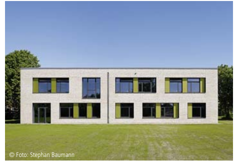
4100-0158 Gemeinschaftsschule Seite 152

petersen pörksen partner architekten + stadtplaner | bda, Lübeck