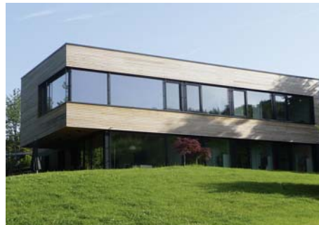
6100-1181 Einfamilienhaus - Passivhaus Seite 734