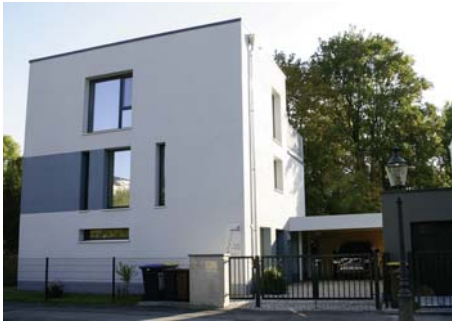
6100-1069 Einfamilienhaus, Büro - Passivhaus Seite 306