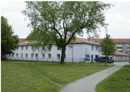
6100-1053 Wohnstätte (29 WE) - KfW 40 Seite 256

MPE Märkische Projektentwicklungsgesellschaft mbH Brandenburg an der Havel