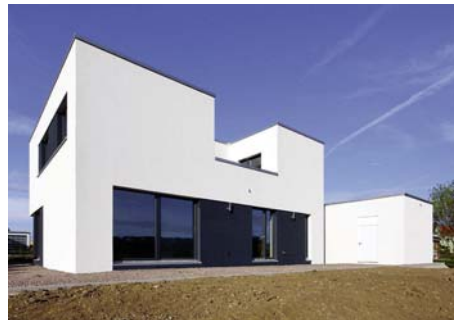
6100-1132 Einfamilienhaus - Effizienzhaus 55 Seite 534

🏠 Werkgemeinschaft Quasten-Mundt Grevenbroich