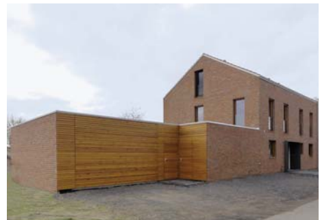
6100-1151 Einfamilienhaus - Effizienzhaus 70 Seite 598

🏠 Werkgruppe Freiburg Architekten Freiburg