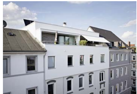
6100-1089 Wohnhaus - Passivhaus Erweiterung Seite 402

🏠 HGMB Architekten GmbH + Co. KG Düsseldorf