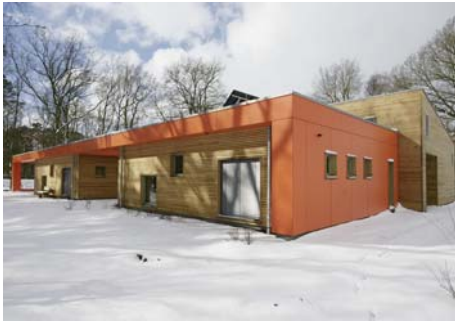
4400-0225 Kinderkrippe (2 Gr., 30 Kinder) Seite 190

🏠 Bosse Westphal und Partner Winsen/Luhe