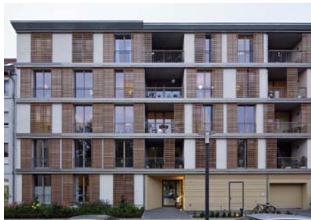
6100-1063 Mehrfamilienhaus - Passivhaus Seite 286

🏠 Architekturbüro Augustin & Imkamp Leipzig