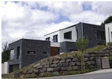
6100-1068 Einfamilienhaus - Effizienzhaus 70 Seite 300

🏠 Architekturbüro Augustin & Imkamp Leipzig