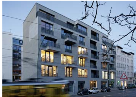
6100-1155 Mehrfamilienhaus, Gewerbe, Atelier Seite 614