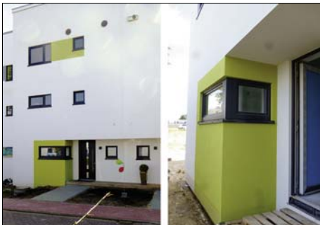
6100-1156 Reihemittelhaus - Passivhaus Seite 620

⌂ walk | architekten Seeger Müller Architekten, Berlin