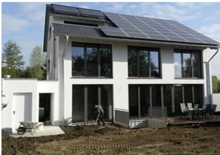
6100-1164 Einfamilienhaus, ELW - Passivhaus Seite 664