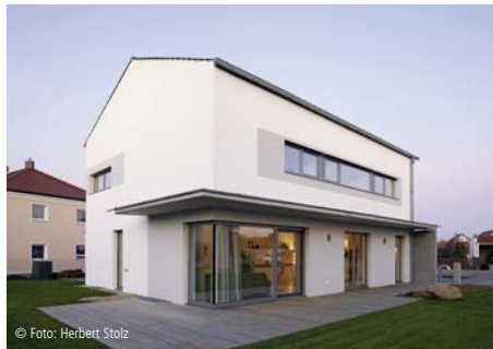
6100-1104 Einfamilienhaus - Effizienzhaus 85 Seite 442