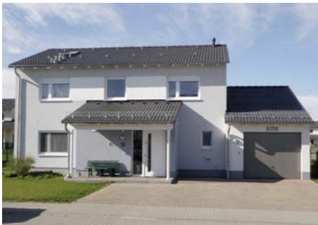
6100-1116 Einfamilienhaus - Effizienzhaus 70 Seite 476