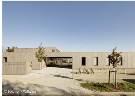
4400-0230 Kindertagesstätte (6 Gr., 90 Ki.) Seite 196

🏠 Bosse Westphal und Partner Winsen/Luhe