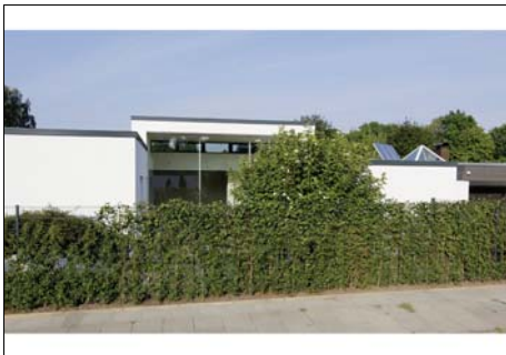
6100-1159 Einfamilienhaus - Effizienzhaus 40 Seite 632 Modernisierung

⌂ AIN Architektur-Ingenieur-Netzwerk GmbH Halle (Saale)