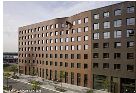
9100-0099 Ökumenisches Zentrum Seite 848