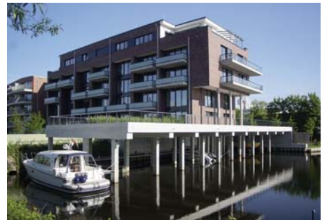
6100-1146 Mehrfamilienhaus - Effizienzhaus 70 Seite 582

🏠 Concavis Architekten + Ingenieure Bornheim