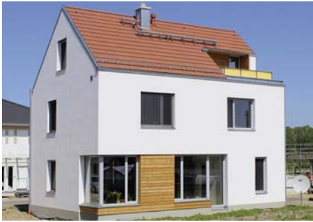
6100-1123 Einfamilienhaus - Effizienzhaus 55 Seite 504