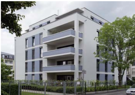
6100-1061 Mehrfamilienhaus - Effizienzhaus 70 Seite 280

🏠 Stiehl + Lüders Baubetreuung GbR Wiesbaden