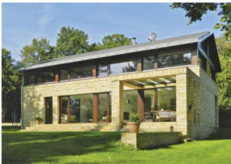
6100-1120 Einfamilienhaus - Effizienzhaus 85 Seite 492