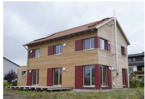
6100-1097 Einfamilienhaus - Effizienzhaus 55 Seite 414