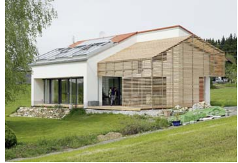
6100-1190 Einfamilienhaus - Effizienzhaus 40 Seite 750