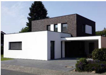
6100-1168 Einfamilienhaus - Effizienzhaus 40 Seite 680