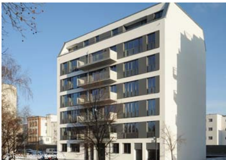
6100-1073 Mehrfamilienhaus - Effizienzhaus 70 Seite 330