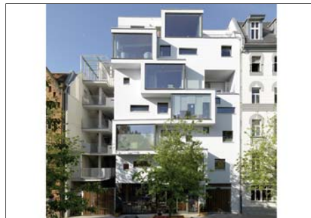
7200-0084 Wohn- und Geschäftshaus (7 WE) Seite 822