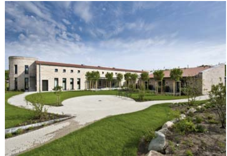
6200-0063 Hospiz (16 B) - Effizienzhaus 85 Seite 766

Architektur Contor Müller Schlüter Wuppertal