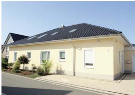
6100-1142 Einfamilienhaus - Effizienzhaus 55 Seite 572

🏠 Concavis Architekten + Ingenieure Bornheim