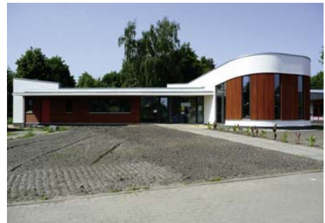
6400-0082 Gemeindehaus Seite 778

hage.felshart.griesenberg Architekten BDA Ahrensburg