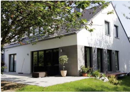
6100-1162 Einfamilienhaus - Effizienzhaus 70 Seite 648 Modernisierung