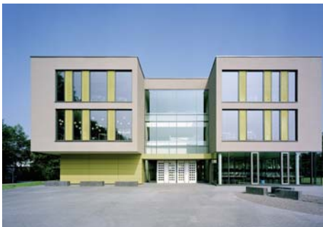
4100-0150 Ganztageschule mit Mensa Seite 134

brüchner-hüttemann pasch bhp Architekten + Generalplaner GmbH, Bielefeld