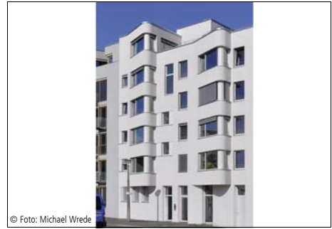
6100-1163 Mehrfamilienhaus - Effizienzhaus 55 Seite 658