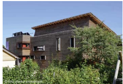
6100-1057 Einfamilienhaus - Effizienzhaus 40 Seite 262

MPE Märkische Projektentwicklungsgesellschaft mbH Brandenburg an der Havel