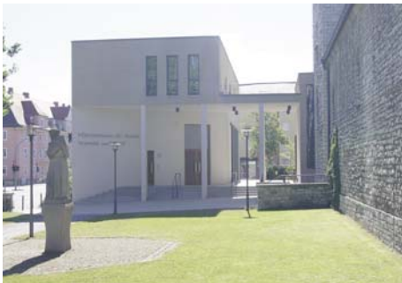
6400-0085 Pfarrzentrum Seite 800