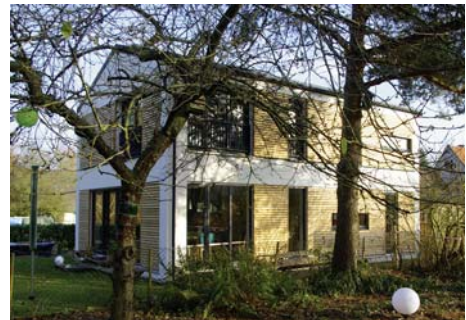
6100-1167 Einfamilienhaus - Effizienzhaus 40 Seite 674