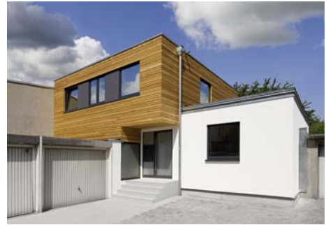
6100-1086 Einfamilienhaus - Effizienzhaus 55 Seite 390

🏠 HGMB Architekten GmbH + Co. KG Düsseldorf