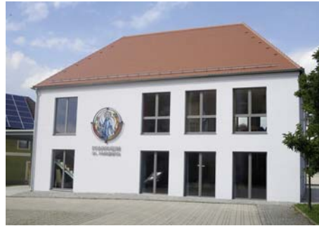
6400-0084 Pfarr- und Jugendheim Seite 790